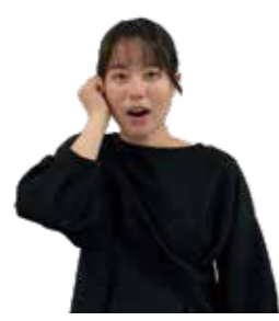
右手のこぶしをこめかみに当てる