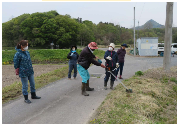
草刈り機の使い方を教えてもらう参加者

4月25日に岡谷町地内にて、女性農業者向け「草刈り講習会」を開催しました。当日は8名の女性農業者、女性農業委員が参加しました。JA利根沼田と株式会社マキタより講師を招いてモーター式草刈り機の紹介や安全な草刈り機の使い方、草刈り機の手入れの方法などのレクチャーを受けました。参加者からは「今まで草刈り機を使用したことがなかったので、今回の講習会で教えてもらったことは良い経験になりました。エンジン式の草刈り機は知識が無く使用するのに抵抗がありましたが、モーター式の物なら手入れも簡単で充電すれば使えるので、購入して使用してみたい」という感想をいただきました。昨年度は「リース作り講習会」「多肉植物の寄せ植え講習会」を開催しましたが、今後も講習会を開催しますので、興味がある方は是非ご参加ください。