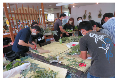
昨年度のぬまた農縁の様子