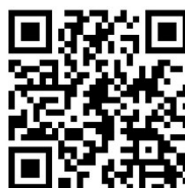
ぬまた農縁 申し込みフォーム