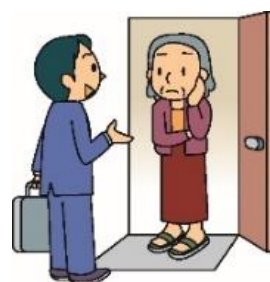
消費者庁イラスト集より

「どんな衣類でもいいから売ってほしい」と女性から電話があった。後日、男性が来訪し、衣類を見せたが「金貨やアクセサリーはないか」と言われた。母の形見の指輪など貴金属を見せ、売却するのを迷っていたら買取業者が1,000円札を置いて貴金属を勝手に持ち帰ってしまった。