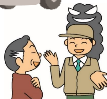
消費者庁イラスト集より