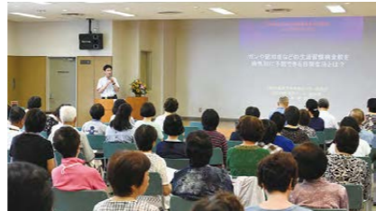
過去の健康講演会の様子

市が取り組む活動量計を使ったウォーキングによる健康づくりの一環として、ウォーキングと乳酸菌シロタ株の組み合わせによる生活習慣病の予防効果について、講演会を開催します。