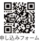
申し込みフォーム

対象 市内在住または在勤の人 定員 ①③12人 ②8人 (先着順) 教材費 実費負担