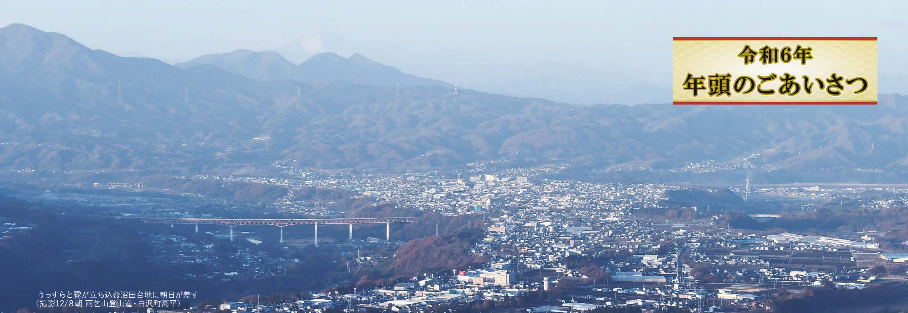
うっすらと霧が立ち込む沼田台地に朝日が差す (撮影12/8朝 雨乞山登山道・白沢町高平)