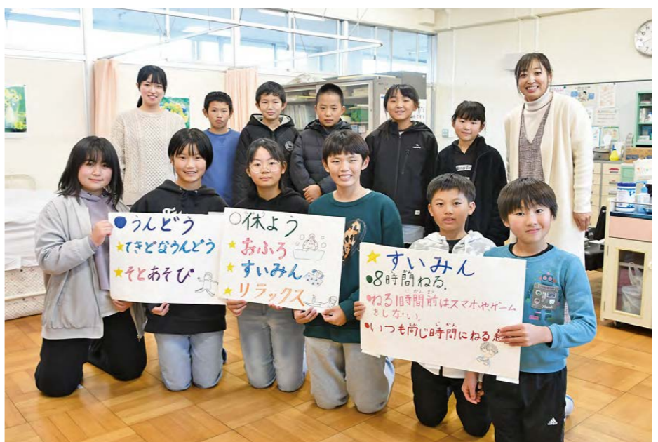
調査をまとめた掲示を持ち、睡眠の質向上を呼びかける保健委員会の児童