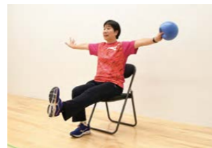
運動教室(イメージ)

椅子に座ったままの運動を中心に、いつまでも元気に過ごせる体づくり・脳トレ・筋トレを無理なく行います。姿勢の特徴を把握し、未来の姿も分析できる姿勢解析測定や、体脂肪量と筋肉量が分かる体組成測定も行います。初めての方も安心して参加できますので、この機会にミズノウエルネス沼田で運動を始めてみませんか。