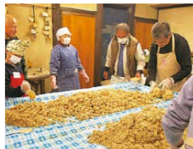
みそ作り(イメージ)

みそ・うどん・こんにゃく作り教室に参加してみませんか。手作りの魅力は何といても「おいしさ」です。出来たてのうどんやこんにゃくを味わってみましょう。