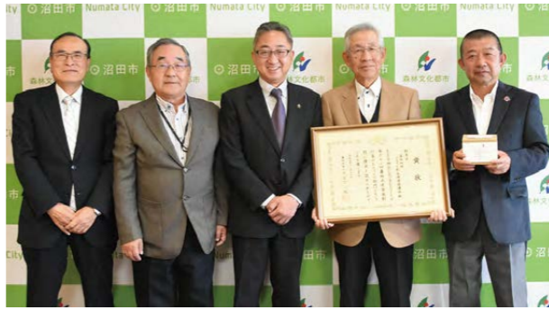
◎11/20 テラス沼田4階応接室 受賞報告

石墨棚田を地域資源として生かし、地域住民だけでなく都市部の人々も巻き込んだ棚田オーナー制度や体験交流イベントなどが地域活性化につながり、むらづくりのモデル事例になり得ることが評価されました。