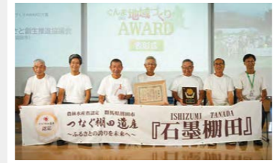
◎ぐんま地域づくり AWARD 大賞も受賞しています 8/1 群馬県庁 表彰式