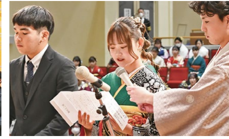
誓いの言葉では、感謝の気持ちを忘れずに、自分らしく、誇り高く生きることを約束した