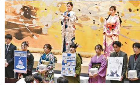
能登半島地震の被災地を思い、ポスターと募金箱を持ち支援を呼び掛ける同委員