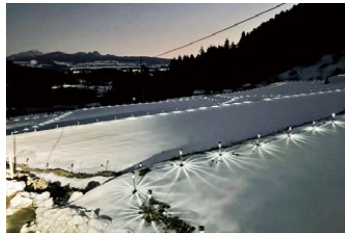
雪が降ったときの石墨棚田イルミネーション(一昨年)