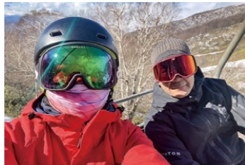
娘とパウダースノーを楽しみました

毎年好評の「みそ作り体験」2~3月開催予定! 詳しくは、薄根地区ふるさと創生推進協議会のHPへ