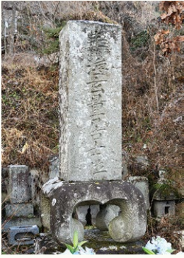
「寿海玄量居士」と刻まれた甚内の墓

法神流と神道一心流による剣術の流儀争いの「園原騒動」。文政13年(1830)、法神流の星野房吉が奉納した「平川古滝庵不動尊」の掲額