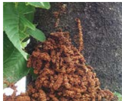
木の幹に排出されたフラス

幼虫が木の外に排出する木くずとフンが混ざったフラスは、被害の発生が外見から確認できる貴重な情報です。フラスは春から秋にかけて大量に排出され、形は多くがかりんとう状をしており、木の幹や枝の間、根元にたまります。