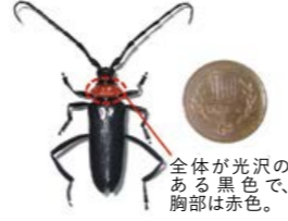
全体が光沢のある黒色で、胸部は赤色。

クビアカツヤカミキリの成虫は、体長2〜4cmと比較的大型で、クビ(虫でいう胸の部分)が赤く、体はツヤのある黒色をしています。6〜8月に発生し、特に6月下旬から7月中旬が発生のピークです。