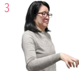
3 5指を折り曲げ、指を 下に向けて軽く下ろす