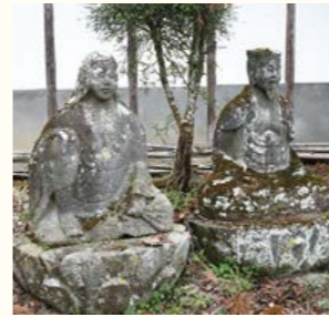
懸衣翁(右)と奪衣婆(左)の像。冥界の最初の裁きを行う番人ではあるが、柔和で温厚な表情がうかがえる。

死後、冥土へ向かうときに誰しも渡ると言われる三途の川。その川のほとりには、恐ろしい形相の鬼女、奪衣婆が待ち構え、亡者の衣を剥ぎ取り、岸辺の衣領樹という大木に懸衣翁に渡す。翁はそれを枝に懸け、枝のたるみ具合により生前の罪の軽重を測り、三途の川の渡場を指示する。罪の深い者ほどヒルなどのいる深水を渡らされ、罪の軽い者は橋などを渡れるという。冥界の最初の裁きである。先人達は、冥府入口の番人一对の像を刻み、祈願して罪の軽減を図った。