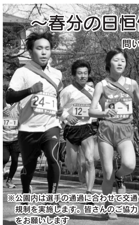
※公園内は選手の通過に合わせて交通規制を実施します。皆様のご協力をお願いします