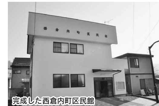
完成した西倉内町区民館

お問い合わせ 環境課廃棄物係(東原庁舎内) ☎内線77373 ご利用ください 沼田市ぐんま新技術・新製品開発推進補助金制度 新製品や新商品の開発に要する費用の一部を助成します。 対象事業者 市内に主たる事業所を有する中小企業者と各種中小企業団体 対象事業 中小企業者が自ら行う新製品・新商品に関する開発で、事業化と市場性が見込まれるもの 対象経費 原材料や副資材の購入に要する経費▽機械装置または工具器具の購入、改良、据付、借用などに要する経費 ▽外注加工に要する経費▽開発に必要な市場調査、大学など試験研究機関との共同研究、データ試験などに要する経費 ▽外部からの各種専門家の指導に要する経費▽研究開発成果の知財出願などに要する経費 補助額 対象経費から20万円を減じて得た額(上限80万円) 申し込み 4月1日(水)から5月15日(金)までに所定の申請書に必要事項を記入し、産業振興課商工振興係へ お問い合わせ 産業振興課商工振興係 ☎内線32555