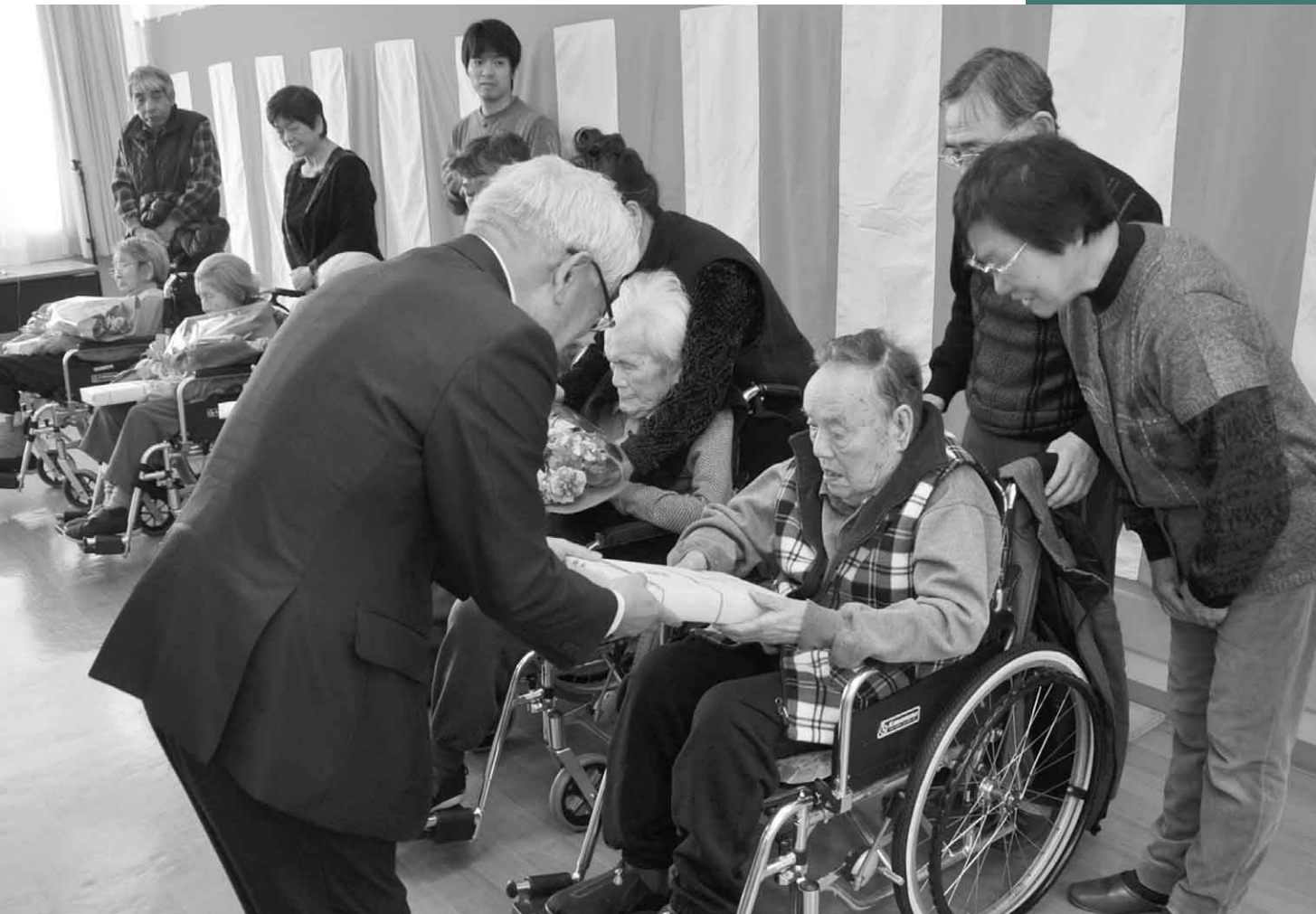
2月12日 高齢者慶祝事業(特別養護老人ホームきぎょうの里)