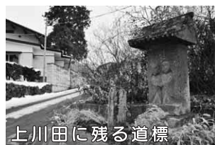
上川田に残る道標

は橋が架けられた。渡し舟は、川の両側に杭を打ち、ワイヤーで舟をつなぎ、そのワイヤーを手で探りながら進んだ。順調に舟が渡れる時は白色の旗を、大水で舟が出せない時は赤色の旗を渡し場に立て、遠くからでも渡船が可能分かるよう工夫されていた。舟が出ない場合には驚石橋を回った。渡船には渡し賃が必要で、冬の橋の時は上川田の人は無料であった。渡し場には小屋があり、番人が常駐していた。橋は12月頃、上川田の各家から人足が出て、2～3日かけ設置。材料は共有林の杉の丸太が使われた。4月頃、雪しろで水量が増すと橋は自然に流された(川田の民俗)とあり貴重な話である。真田の時代には藩主も渡船したことがあったという。上川田に残る道標の中、三基に「渡船場ヲ経テ沼田道」「渡船場ヲ経テ硯田道」「渡船場近道」の銘が高山村道や桃野村道などと並び刻まれる。道の、早い変動に道標は意志をみせる。