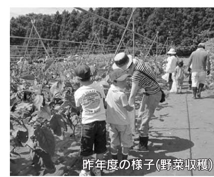
昨年度の様子(野菜収穫)

小中学生の夏休み課外学習の一環として、農作物の収穫作業や収穫した野菜を利用した食品加工を体験できる講座を開催します。