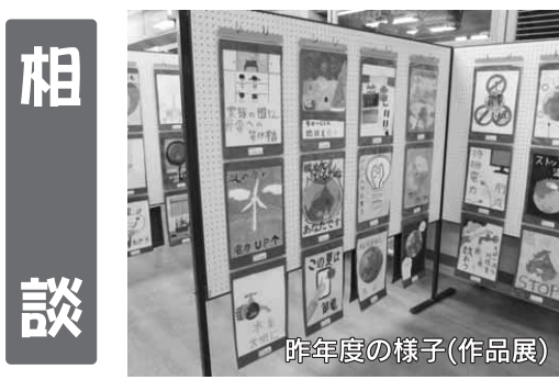
昨年度の様子(作品展)

とき 8月1日(木)午前9時～午後1時 ところ 県立農林大学校農村婦人の家(高崎市箕郷町西明屋1005) 対象 小中学生とその保護者 定員 10組(超えた場合は抽選) ※保護者は原則1人とし、参加費 1組500円(材料費)