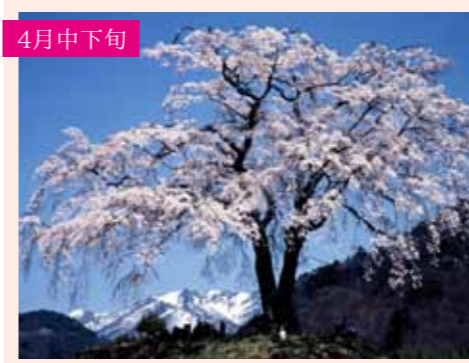
3 上発知のシダレザクラ シダレザクラ 1本桜 樹形の美しい桜と雪山が織りなす芸術 上発知町646 Pなし