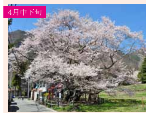
5 山妻有のサクラ エドヒガンザクラ 吹割の滝のあとに訪れたい秘境の桜 利根町追貝826-1 Pなし