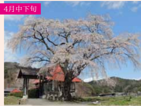
8 天照寺のシダレザクラ シダレザクラ 1本桜 詫びを感じさせる寺と桜の組み合わせ 発知新田町370 Pなし