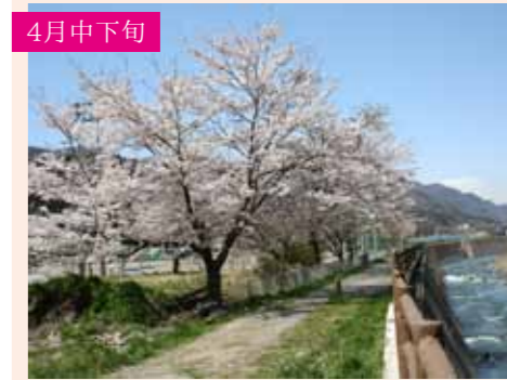
11 老神温泉 ソメイヨシノ 約50本 片品渓谷沿いの温泉街を彩る 利根町老神607-1周辺 P30台