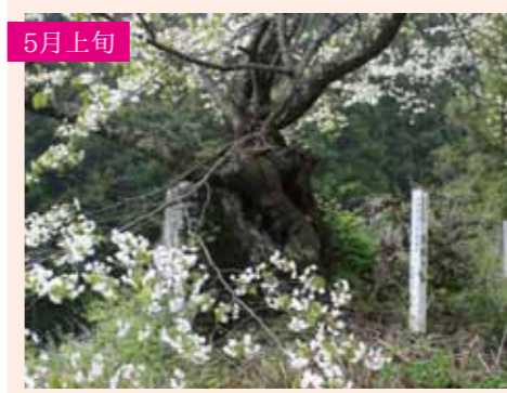
4 石割桜 カスミザクラ 1本桜 根が大石を割り力強く咲く珍しい桜 白沢町高平2537-1 Pなし