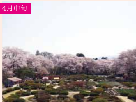
7 沼田公園 ソメイヨシノ 約210本 公園全体が見渡す限り桜色に染まる 西倉内町594(沼田公園) P78台/大型7台