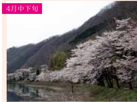
10 菌原湖 ソメイヨシノ 約60本 湖の淵に連なる桜が水面できらめく 利根町菌原2378 P20台