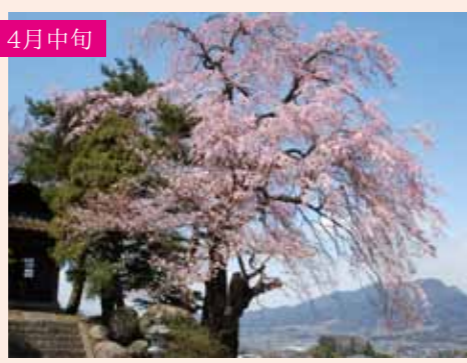
1 下川田のシダレザクラ シダレザクラ 1本桜 雪山や河岸段丘など雄大な景色とともに 下川田町445 Pなし