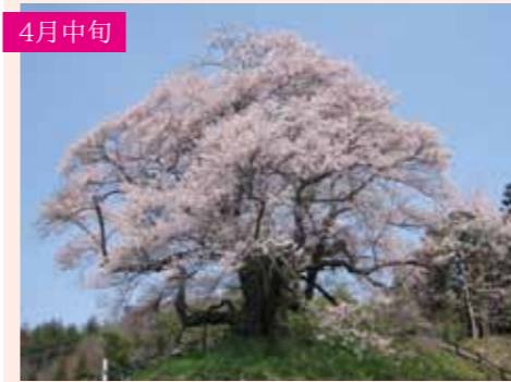
9 発知のヒガンザクラ ヒガンザクラ 1本桜 樹齢約500年、県指天然記念物 中発知町1234 Pなし