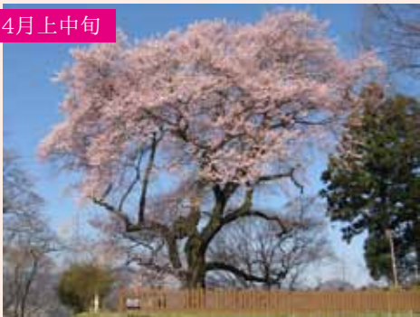
6 御殿桜 ヒガンザクラ 1本桜 樹齢約400年、石垣の上に佇む 西倉内町594(沼田公園) P78台/大型7台