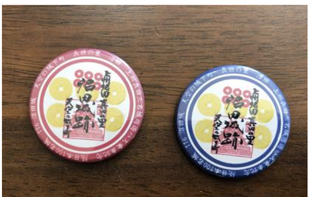
参加賞 (季節によって変わるかも??)