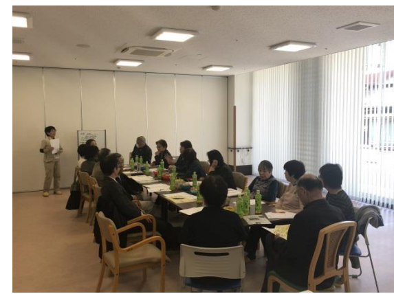
1階 地域交流スペース (活動風景)