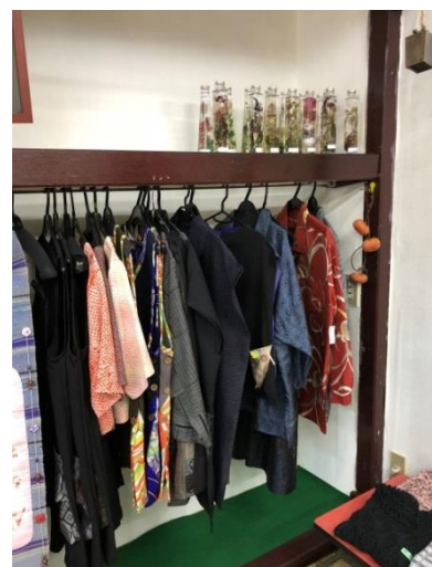
和服をアレンジした服