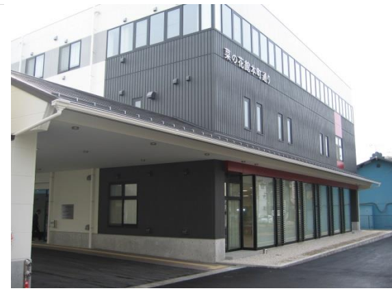
菜の花館本町通り 外観

1階の地域交流スペースについては地域住民との交流を広げ地域の活性化を考えた場所となっております。現在は市民団体による会議やヨガなどが行われています。6月からは第2、第4土曜日の正午～午後1時半の間に「まちの子ども食堂」が開催される予定となっております。今後さらに活用されることが見込まれます。