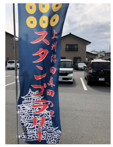
この登り旗がスタンプ設置店の目印です！

本町通り商店街連合会と沼田市観光協会の企画で、まち歩きをしてもらうことを目的とした「天空の城下町 真田の里沼田 スタンプラリー」が始まりました。スタンプは本町通り等に全部で6カ所あり、全てのスタンプを押すことで1枚の絵が完成するものとなっております。スタンプの台紙は沼田公園内の観光案内所で購入できます（有料ですが、参加賞等の特典があります）。スタンプラリーの詳細な情報については、沼田市観光案内所 TEL25-85555まで