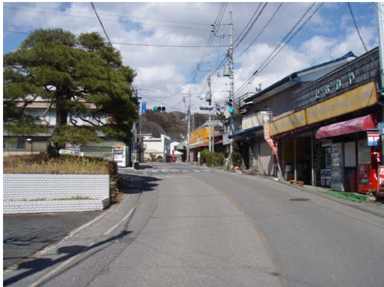
行政施設、金融機関などが集積する地区