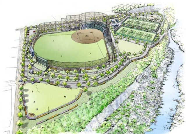
(仮称)利南運動広場