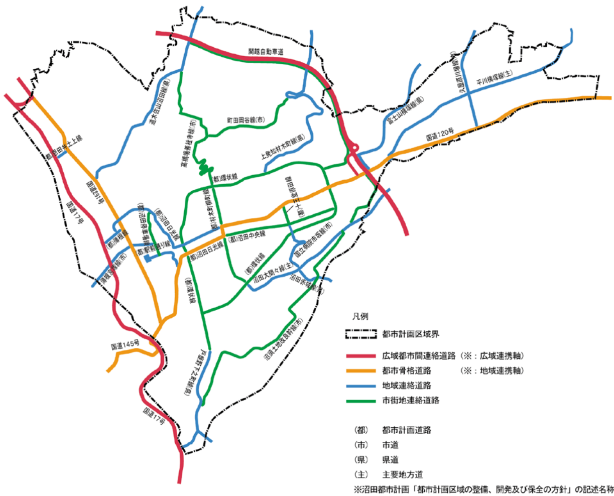
道路ネットワークの整備方針図