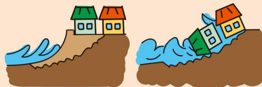
地面が削られ、家屋は建物ごと崩落するおそれがあります