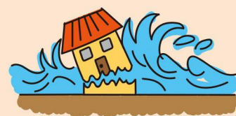
流速が速いため、木造家屋は倒壊するおそれがあります