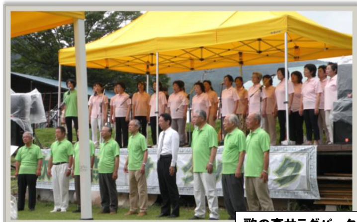
歌の森サラダパーク

目的: 音楽を通じて地域の文化を向上し、 会員相互の親睦を図りながら、 心豊かな社会を創ることを目的としています。