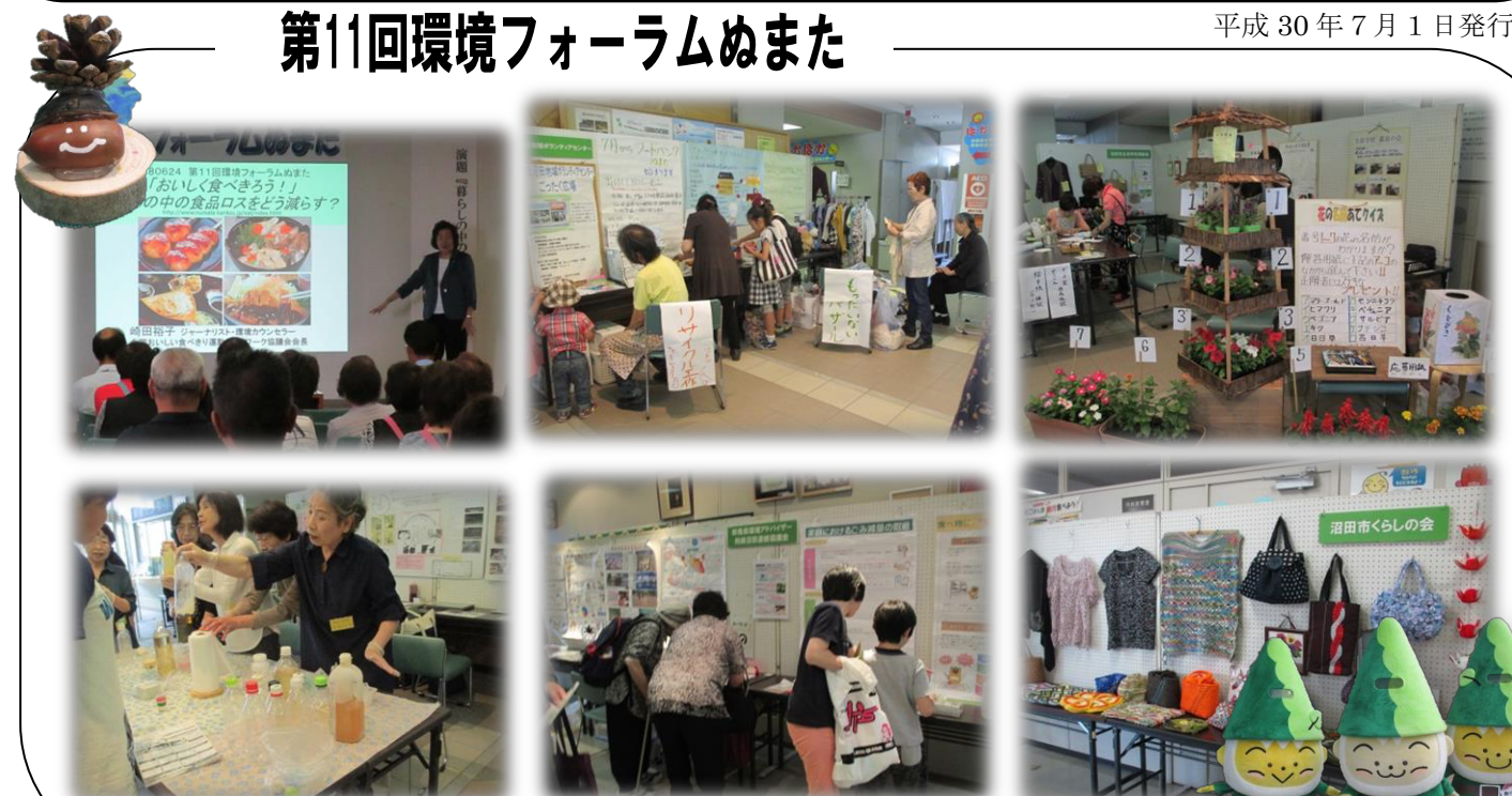
平成30年6月24日 第11回環境フォーラムぬまたの様子