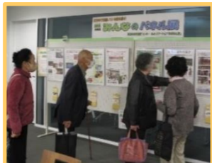
(令和5年11月開催時の様子)

令和5年度第1回「みんなのパネル展」を開催しました 令和5年11月1日(水)~11月30日(木)の間、テラス沼田6階コミュニティテラスロビーにおいて、新規6団体を含む33団体のパネルを展示しました。パネルとともに作製した団体紹介カードも多くの方に持ち帰りいただいたほか、団体の代表者が見学に誘う姿も見受けられました。