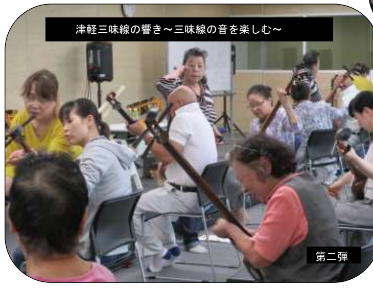
津軽三味線の響き~三味線の音を楽しむ~