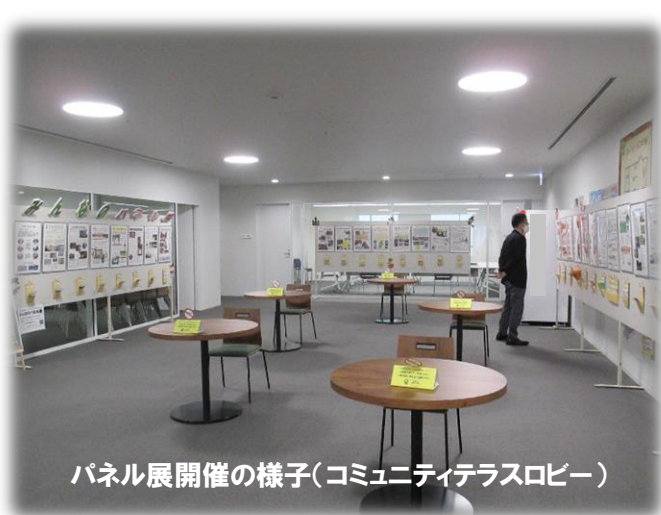
パネル展開催の様子(コミュニティテラスロビー)

※前回は、テラス6階コミュニティテラスロビーにおいて、令和2年10月19日～31日まで開催しました。40団体掲示初めての試みでパネルの一部を探すクイズも取り入れ、親子づれの観覧者も多くみられました。