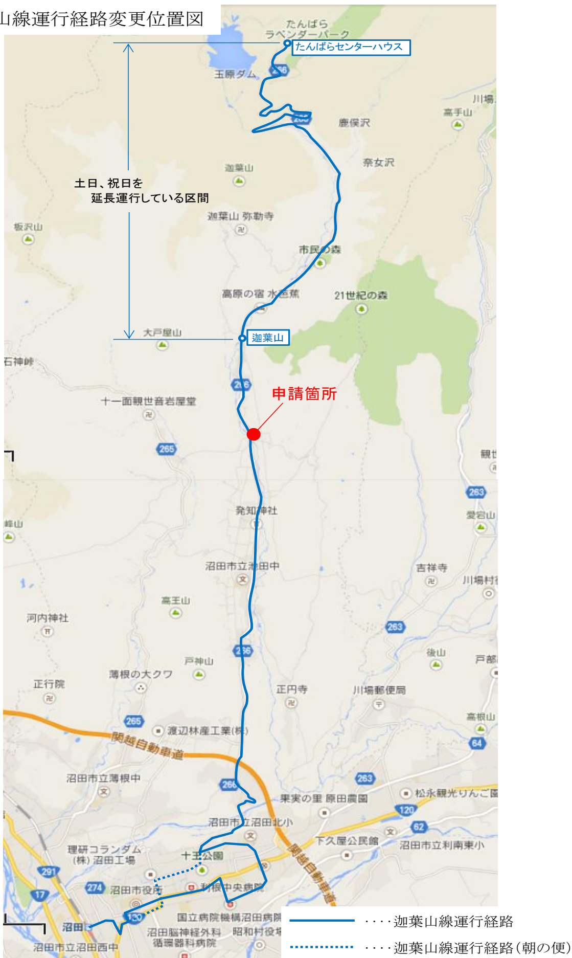
迦葉山線運行経路変更位置図