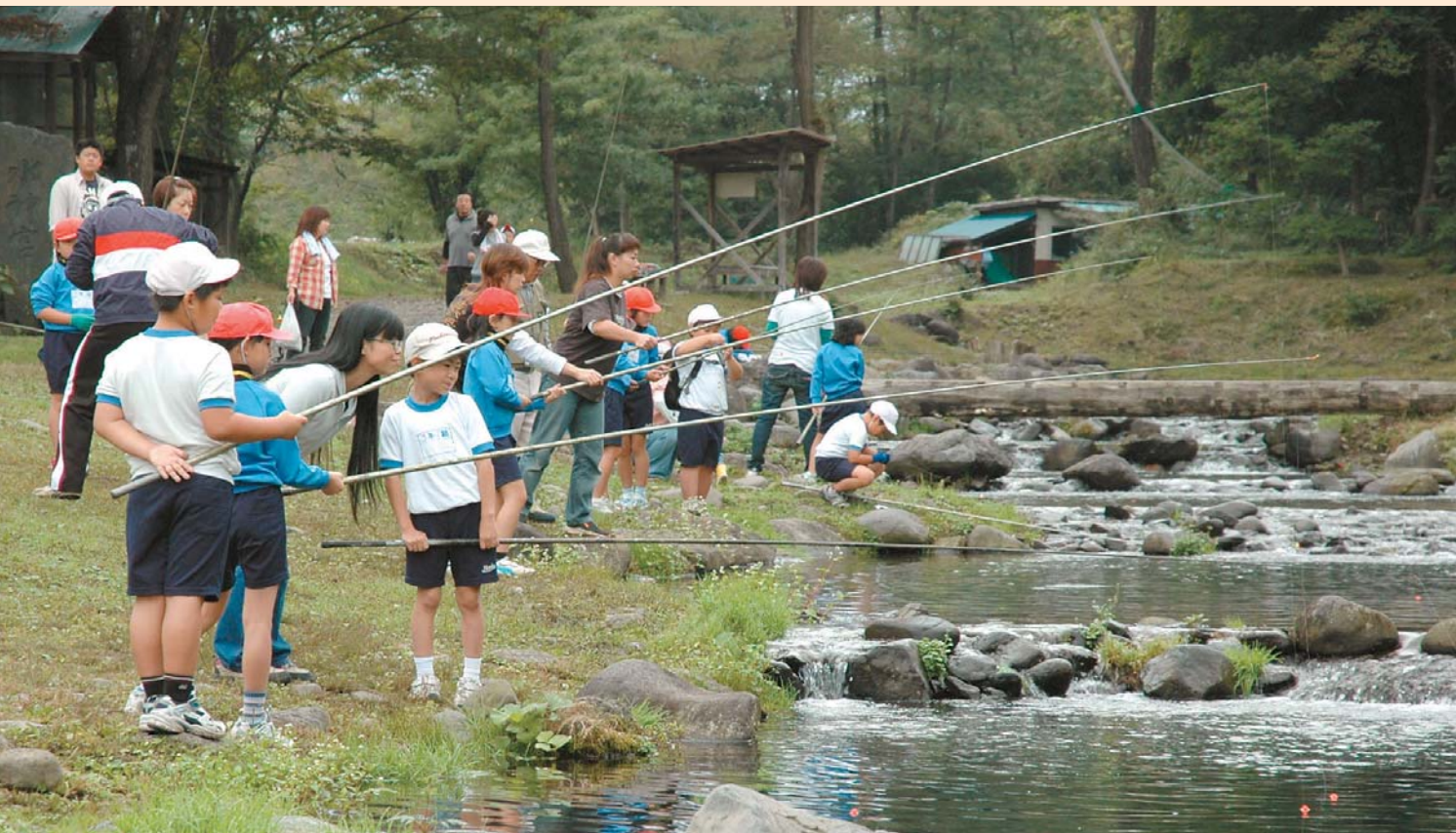
発知溪流つりセンターなどで行われた「漁場ふれあい事業」では、親子で仲良く釣り体験