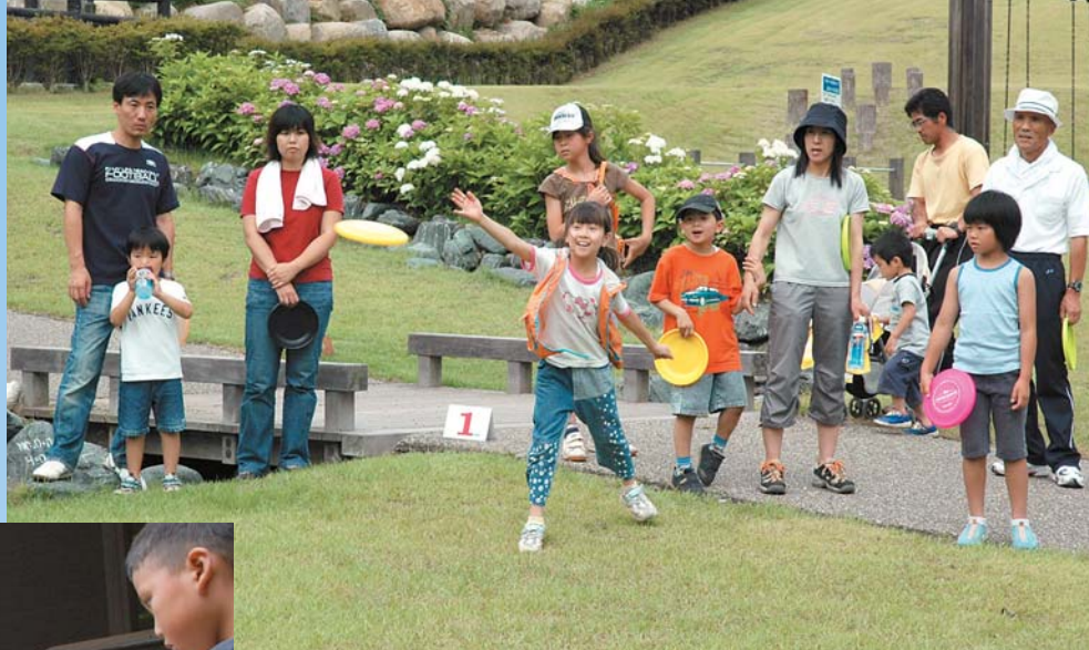
「親子ニュースポーツ講習会」で、グラウンドゴルフやディスクゴルフなどを体験