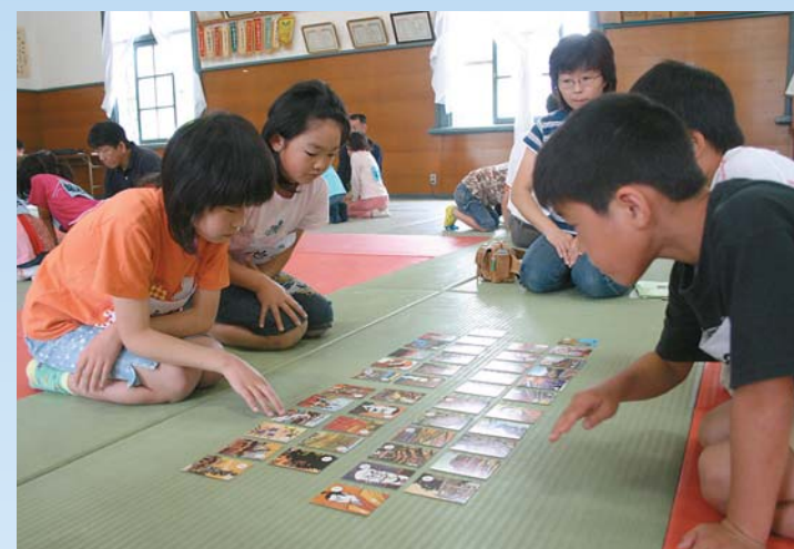
郷土を学びながら競い合う「子ども会沼田かるた大会」