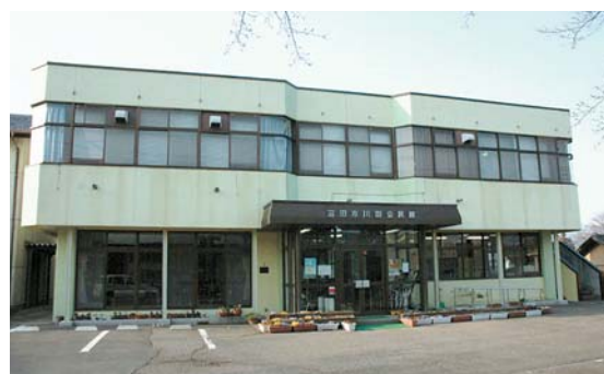
⑩ 川田公民館 下川田町乙798