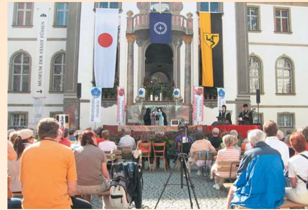
フュッセン市姉妹都市文化交流事業では、フュッセン市役所庁舎前広場で沼須人形芝居を上演