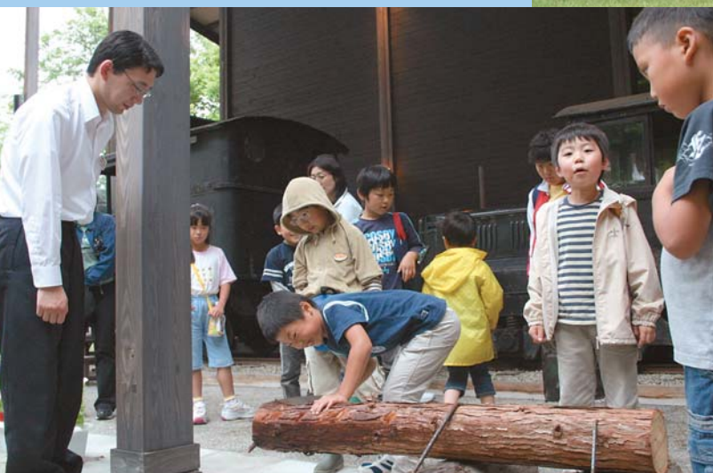
「親子施設見学会」で丸太切り体験