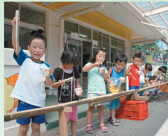
白沢保育園「そうめん流し」で園児が舌鼓