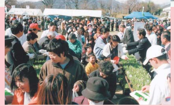
多くの人を訪れた「沼田公園桜まつり」