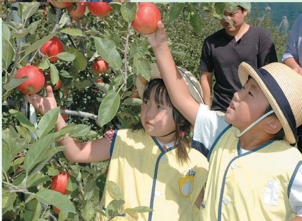
沼田の秋の味覚「りんご園オープン」