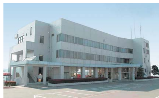
② 白沢町振興局 白沢町平出135-1