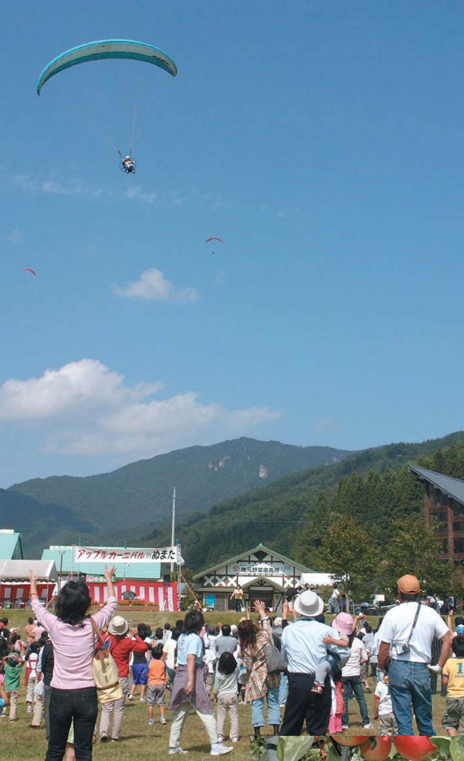
アップルカーニバルがまたのひとこま「空からのプレゼント」