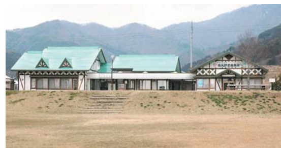
②⑤ サラダパークぬまた 上発知町1708

都市住民と農業農村との交流の施設。レストラン、直売所のほか、遊具や広い芝生広場がある。