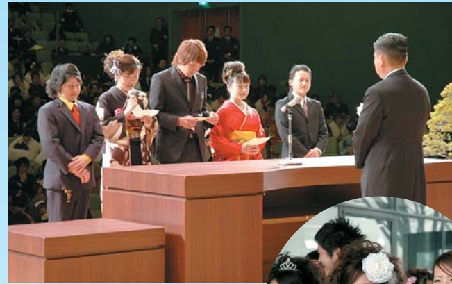
久しぶりの友との再会を楽しんだ「成人式」 今年は、653人が大人の仲間入り