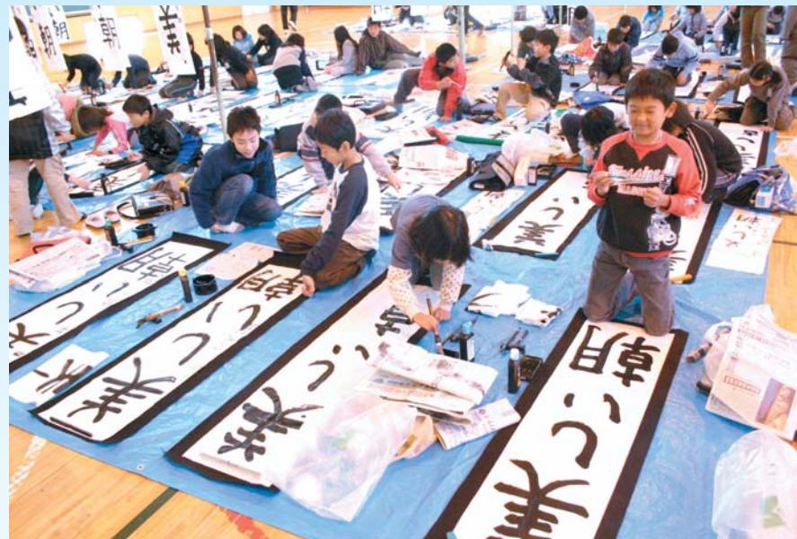
薄根小学校で行われた書き初め(練習会)の様子