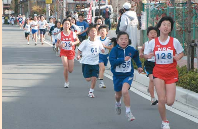
利根沼田ロードレース大会(利南西部コース)で力走する選手たち