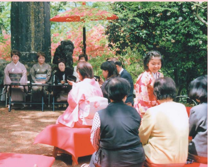
ツツジが見ごろを迎えた沼田公園で、お茶を楽しむ「花の大茶会」