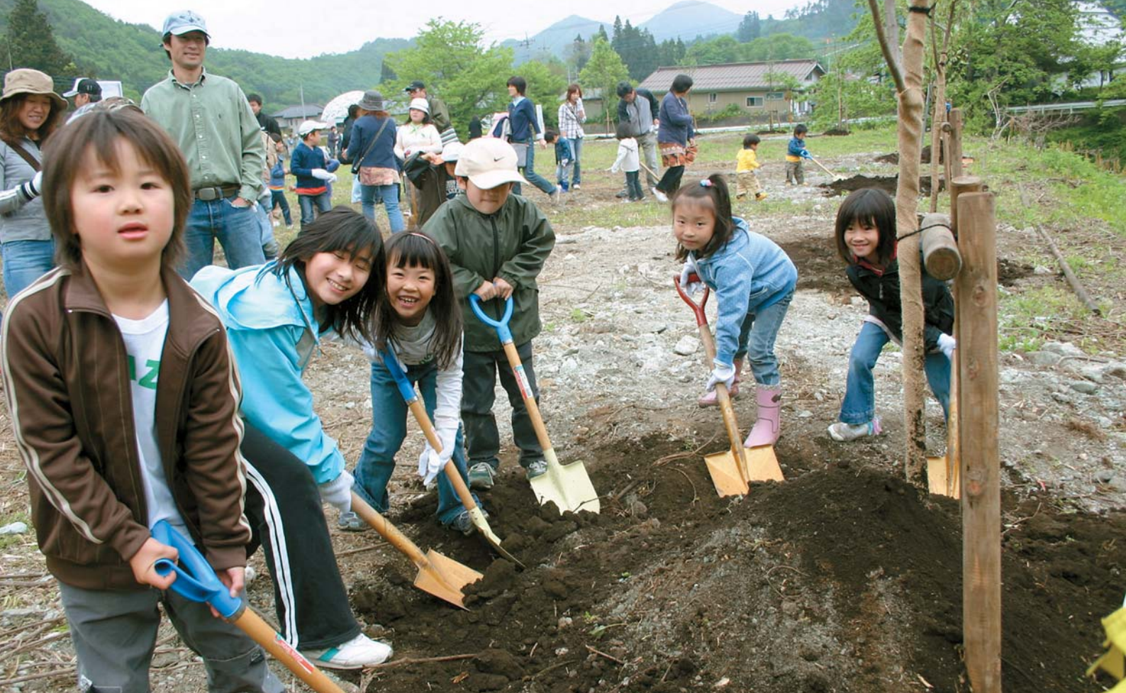
入学を記念して、子どもたちがフゲンザクラを植えた「市民植樹祭」