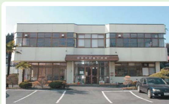
⑦ 利南公民館 上沼須町197