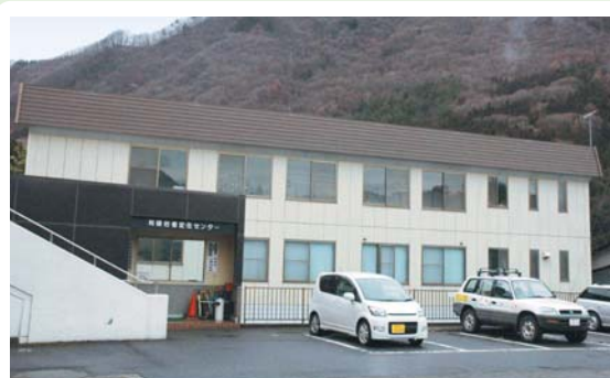
⑫ 利根若者定住センター (利根町教育支所・利根公民館) 利根町追貝37