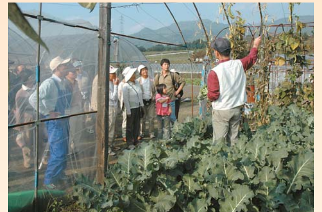
「田舎体験ツアー」農作業やそば打ち体験などで、沼田の魅力をアピール