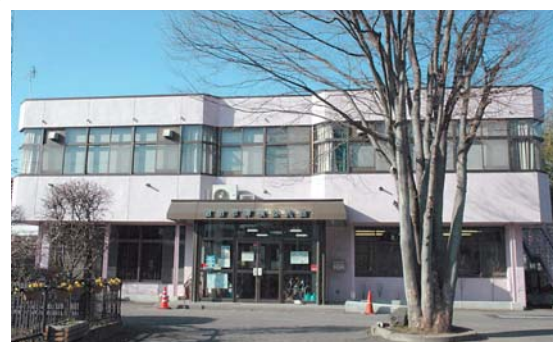
⑨ 薄根公民館 下沼田町733-1