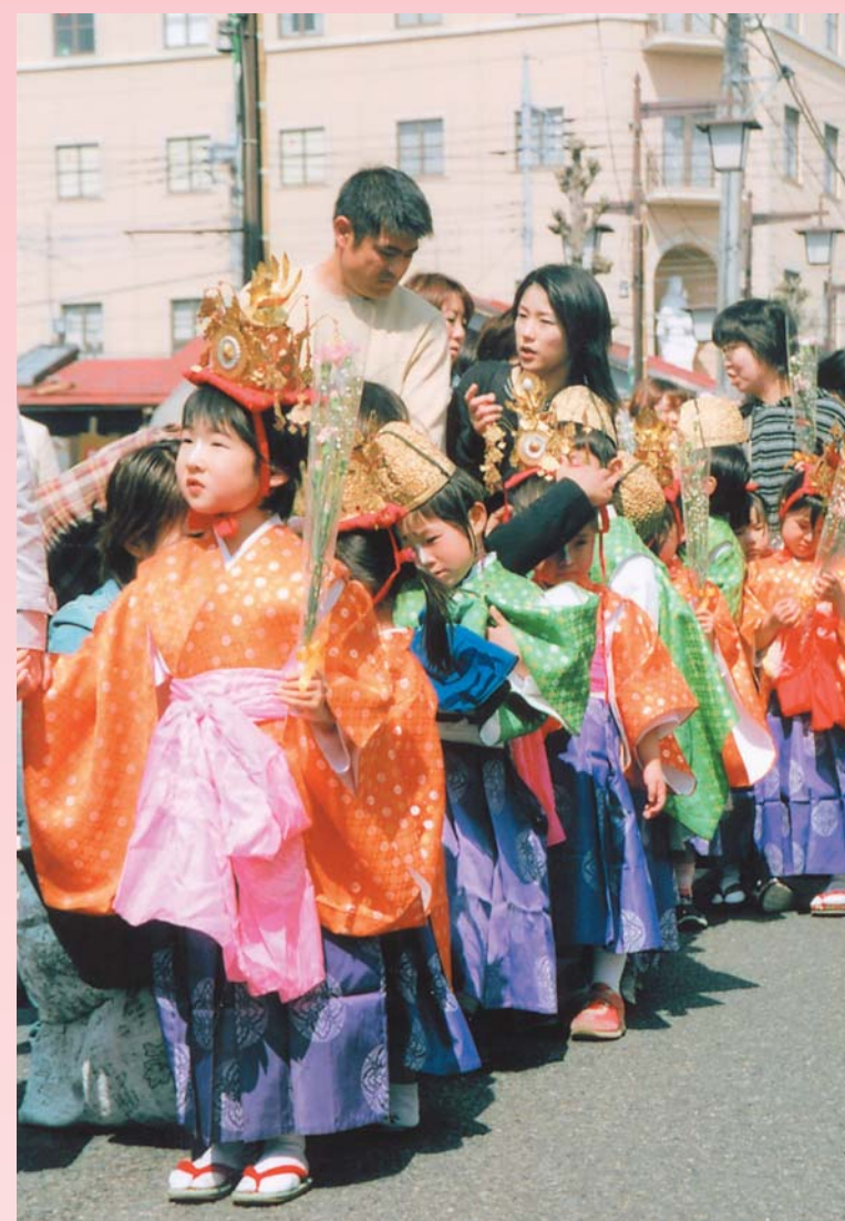
華やかな衣裳で稚児行列(わらべフェスタ・柳波まつり)