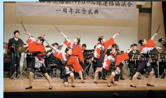
「沼田地区自主防犯パトロール隊連絡協議会一周年記念式典」 地域を見守る自主防犯パトロール隊と式典に華を添えた県警察音楽隊の皆さん