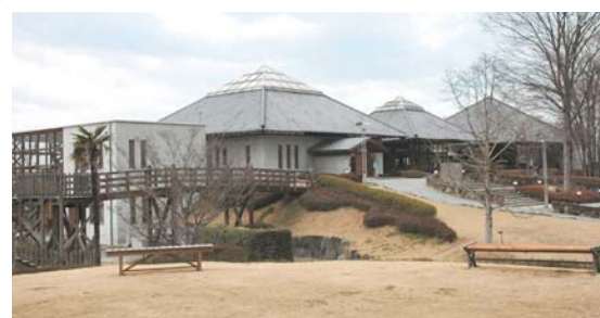
②⑨ 白沢高原温泉 望郷の湯 白沢町平出1297