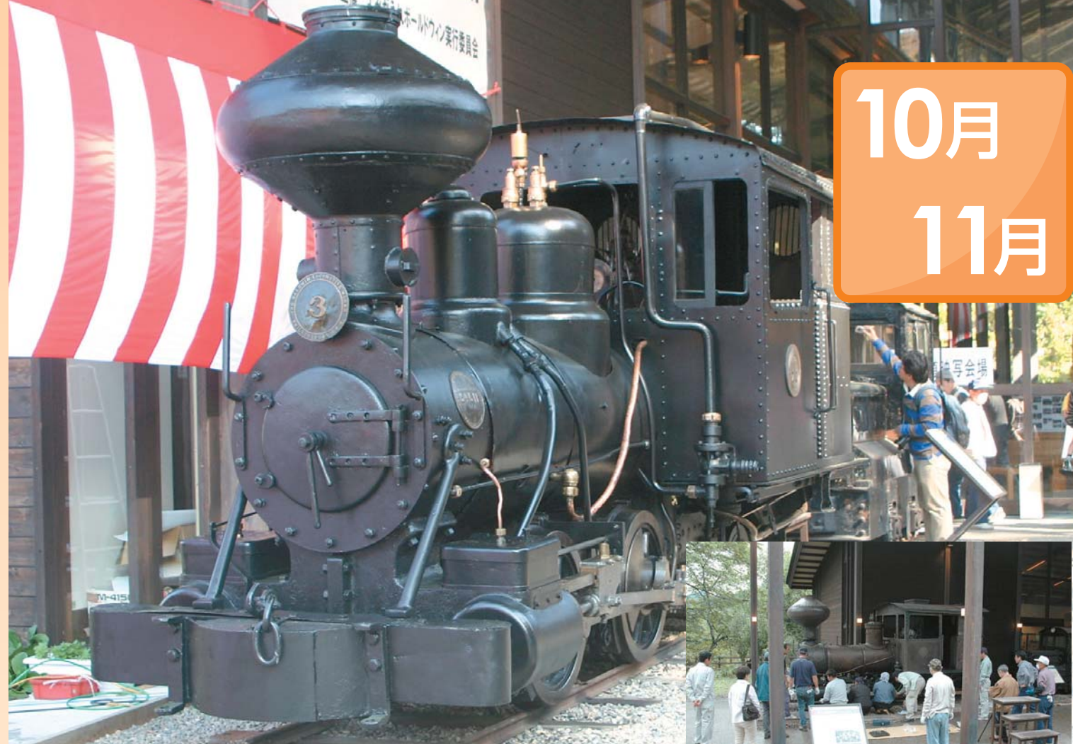
よみがえれボールドウィン実行委員会の皆さんの手により、復活したボールドウィン3号と修復作業の様子(利根町根利の林野庁林業機械化センター)