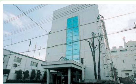
⑥ 市立図書館 西倉内町821-1