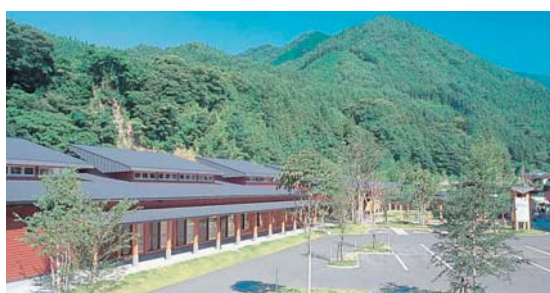
③⑩ 南郷温泉 しゃくなげの湯 利根町日影南郷100