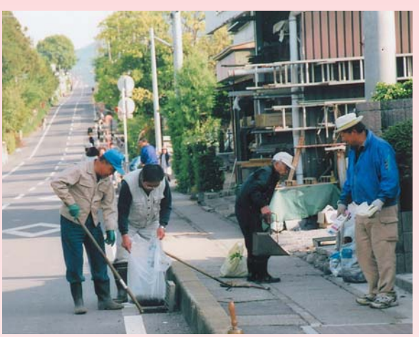
みんなの街をきれいにしよう(春の市内一斉清掃・道路愛護運動)