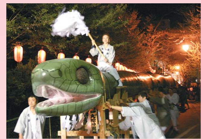
老神温泉街を練り歩く大蛇みこし(大蛇みこし宮出し)