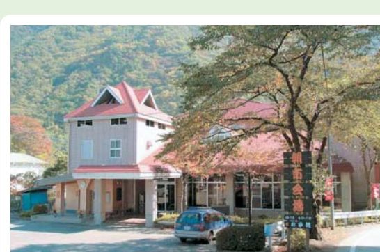
②④ 利根観光会館 利根町老神607