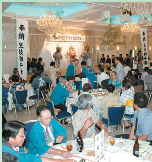
沼田市準市民交流会で、伝統芸能「生枝獅子舞」を披露