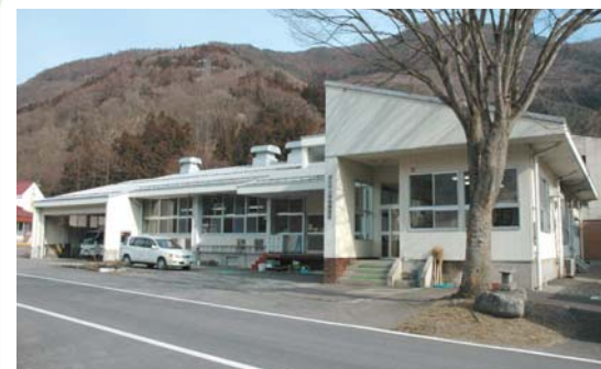
①⑧ 利根調理場 利根町大楊1078-3

都市住民と農業農村との交流の施設。レストラン、直売所のほか、遊具や広い芝生広場がある。