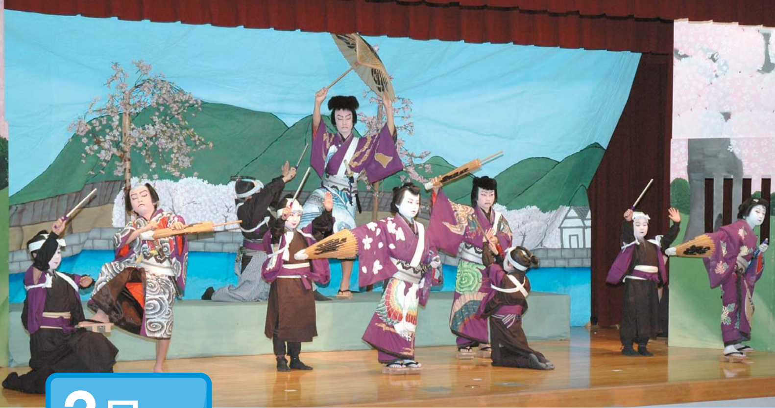
ふるさと文学賞入賞者表彰式で披露され、伝統芸能の素晴らしさを伝える平出子ども歌舞伎「弁天娘女白浪～稲瀬川勢揃いの場～」