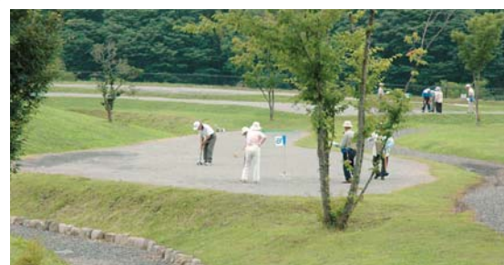
②⑦ 三沢交流広場 白沢町尾合2543先