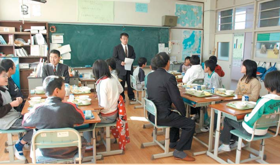
利根沼田産コシヒカリをクラスのみんで楽しく試食「田んぼの王様試食会」(多那小学校)