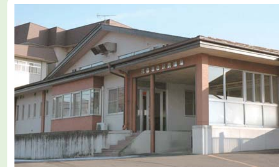
①⑦ 白沢調理場 白沢町高平94-1