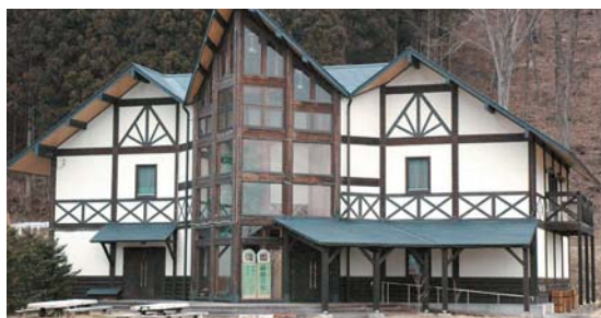
②⑥ 森林の館 上発知町1708