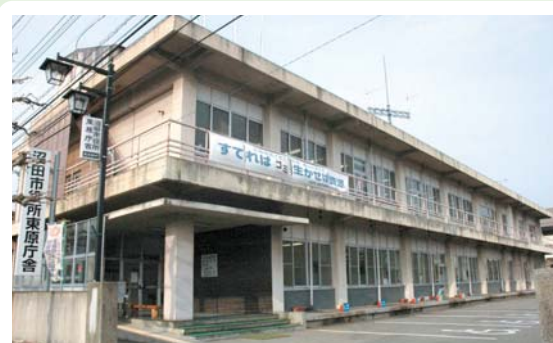
④ 市役所東原庁舎 東原新町1801-40