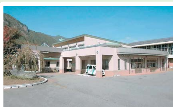
⑬ 利根保健福祉センター 利根町大楊1085-3