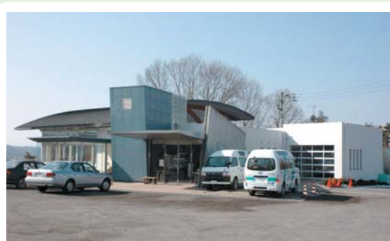
⑭ 白沢健康福祉センター 白沢町平出1312-4