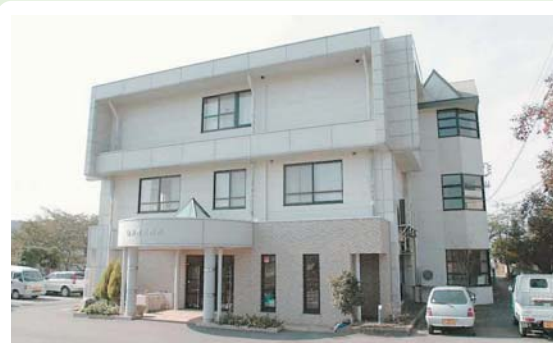
⑪ 白沢公民館 白沢町高平1