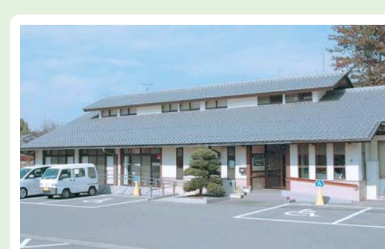
②③ 白沢創作館 白沢町平出135-1