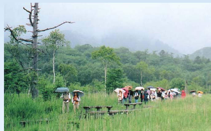
大勢の人が参加した「市民ハイキング」(日光市戦場ヶ原)