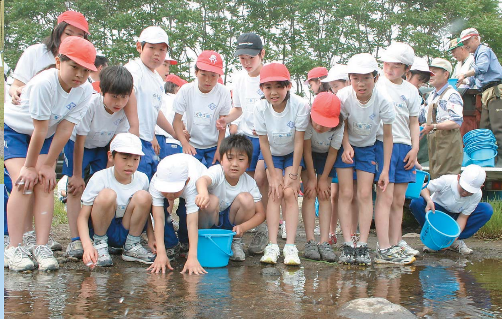
ヤマメやカジカの稚魚を放流した「ふるさとの魚」放流促進事業(薄根川)