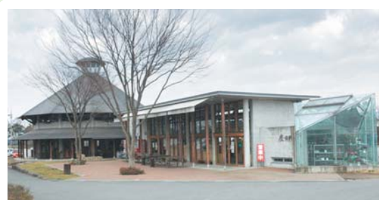
③① 白沢地域特産物展示即売施設 座・白沢 白沢町上古語父152-6