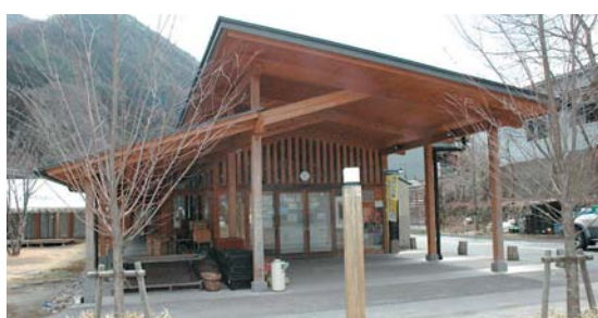
③② 利根南部総合交流施設 南郷市場 利根町日影南郷100