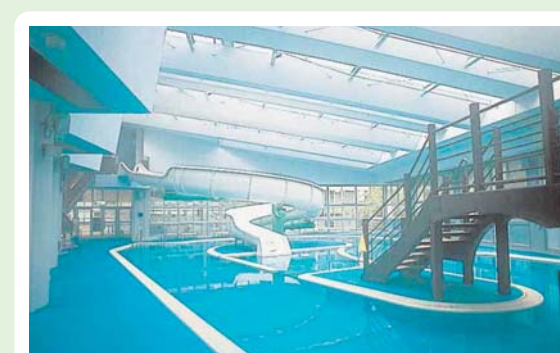
②① 利根温水プール 利根町大楊1086-1