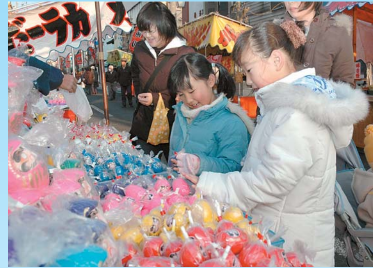
毎年、大勢の人でにぎわう「だるま市」 最近では、華やかな「カラーだるま」も登場