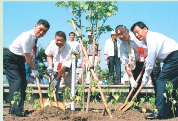
姉妹都市提携40周年を記念して、下田市の皆さんが本市を訪れ、道の駅「白沢」でヤマボウシの木を植樹