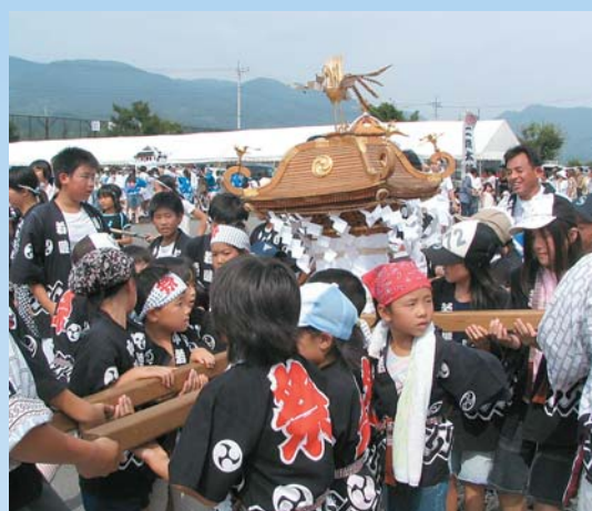
道の駅「白沢」で行われた「白沢ふるさとまつり」のみこしの共演