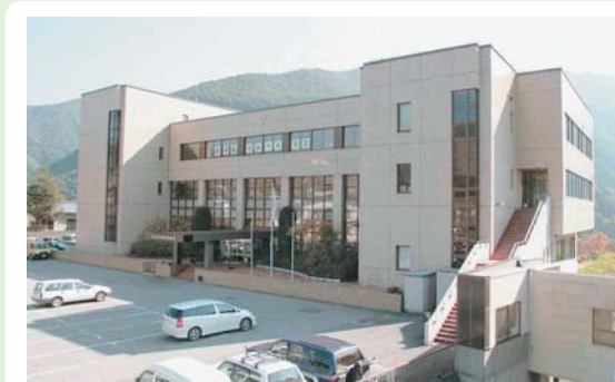
③ 利根町振興局 利根町追貝37