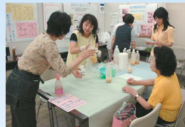
環境フェスティバル(廃油から石けんづくり)