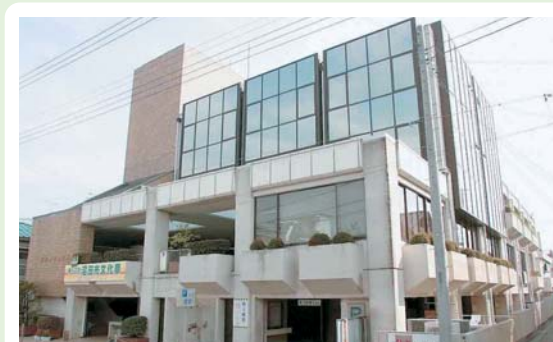
⑤ 中央公民館 東倉内町829-1