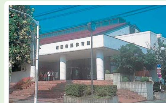
①⑨ 沼田市民体育館 東原新町1801-1