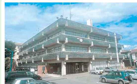
① 沼田市役所本庁舎 西倉内町780