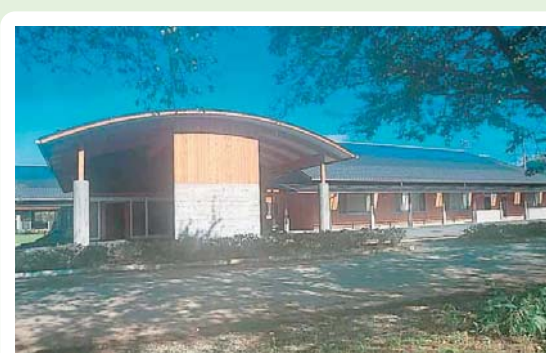
②② ふれあい福祉センター 白岩町189-11