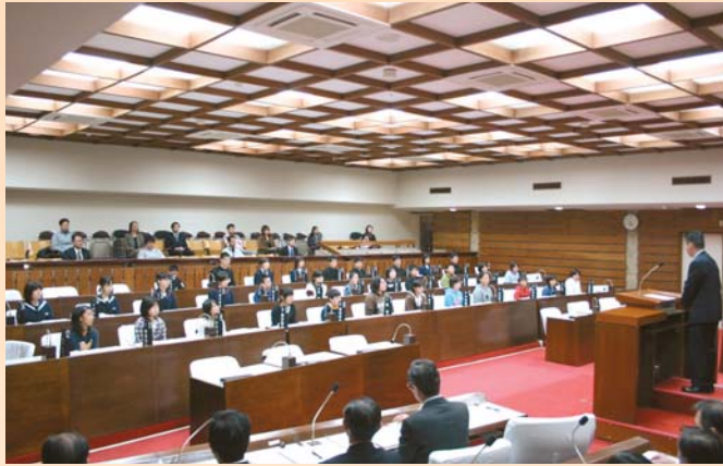
本会議さながらの緊張感の中、33人の議員が教育や福祉、ごみ問題など、子どもたちの視点から質問した「子ども議会」