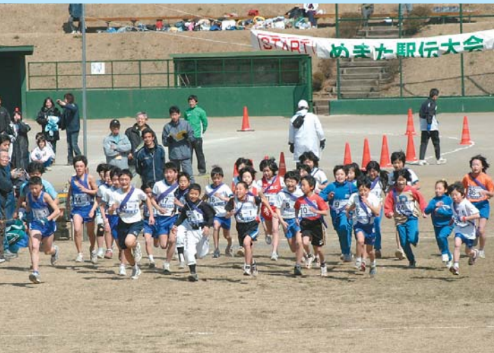
沼田公園に79チーム・395人が集結。熱戦を繰り広げた「ぬまた駅伝大会」