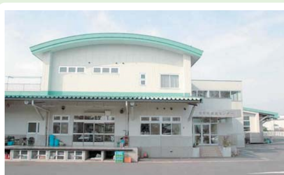
⑯ 給食センター 戸鹿野町730-1