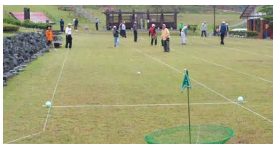
②⑧ ニュースポーツ広場 発知新田町19-1