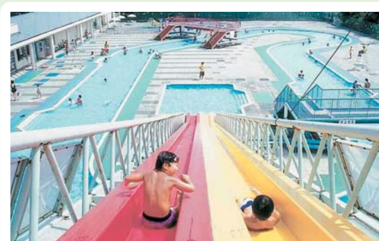
②⑩ 沼田市民プール 硯田町626