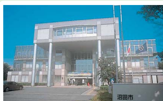
⑮ 保健福祉センター 東原新町1801-72