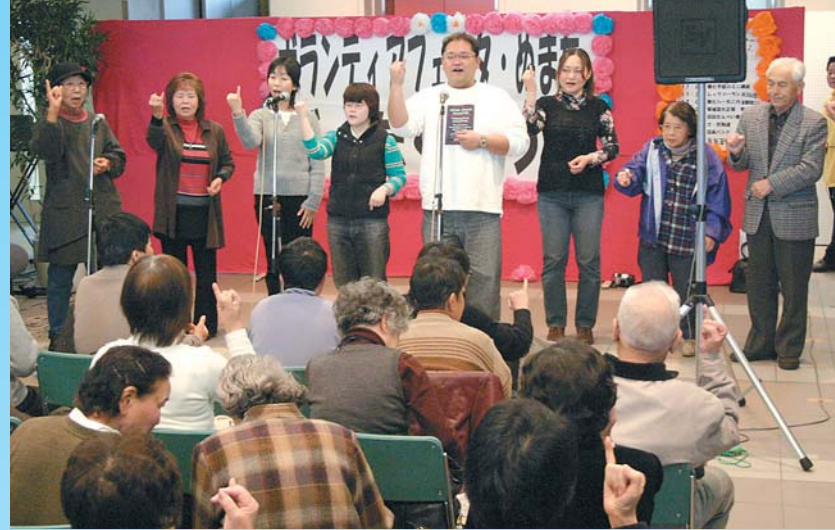
市民とボランティア実践者との相互交流を目的に開催された「ボランティアフェスタ・ぬまた」