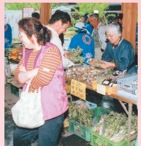
南郷市場で行われた「春の山菜・そばまつり」