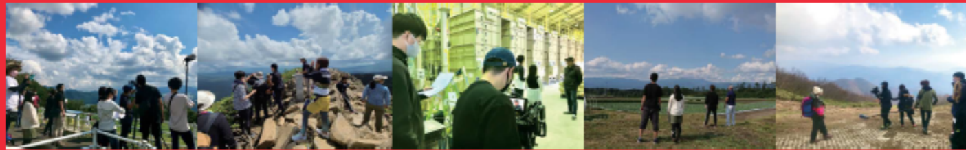
沼田市 片品村 川場村 昭和村 みなかみ町

コロナ禍において事業中止の可能性もありましたが、デジタル活用で非接触のWEBオーディションから始まり、安全対策をしながら演技練習、セリフを覚えたり、ロケハンをして各地を巡り、練習を重ね、ようやく撮影にこぎつけました。 そして利根沼田（沼田市、片品村、昭和村、川場村、みなかみ町）各地の皆さまにご協力をいただきながら合計五日間の撮影を事故もなく無事に終える事ができました。