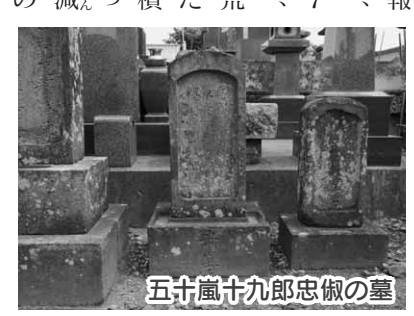
五十嵐十九郎忠俣の墓

て沼田藩へ報告した。また、延享4(1747)年には、村々を廻り荒れ地を調べたり、土地面積の改正を行つた。年貢の減免、未納分の年賦、そして、藩金5百両の5年年賦での貸し付けなどが約束され、領民たちは救われた。豊原では農民の困苦を懇願したが聞き入れられず、城を下がり切腹、血書を以つて再度嘆願し、願いを十九郎が果たしたと伝わり、その温情を子々孫々に語り継ぐため、十九郎が農民を憐れみとした山に「社」を建て「五十嵐神社」とし、神として祭り、その遺徳を顕彰している。昭和39(1964)年、神社前に頌徳碑が建てられた。平等寺には、宝暦6(1756)年12月2日没、法名「自観院釈寂道」の十九郎忠俣の墓が建てられている。