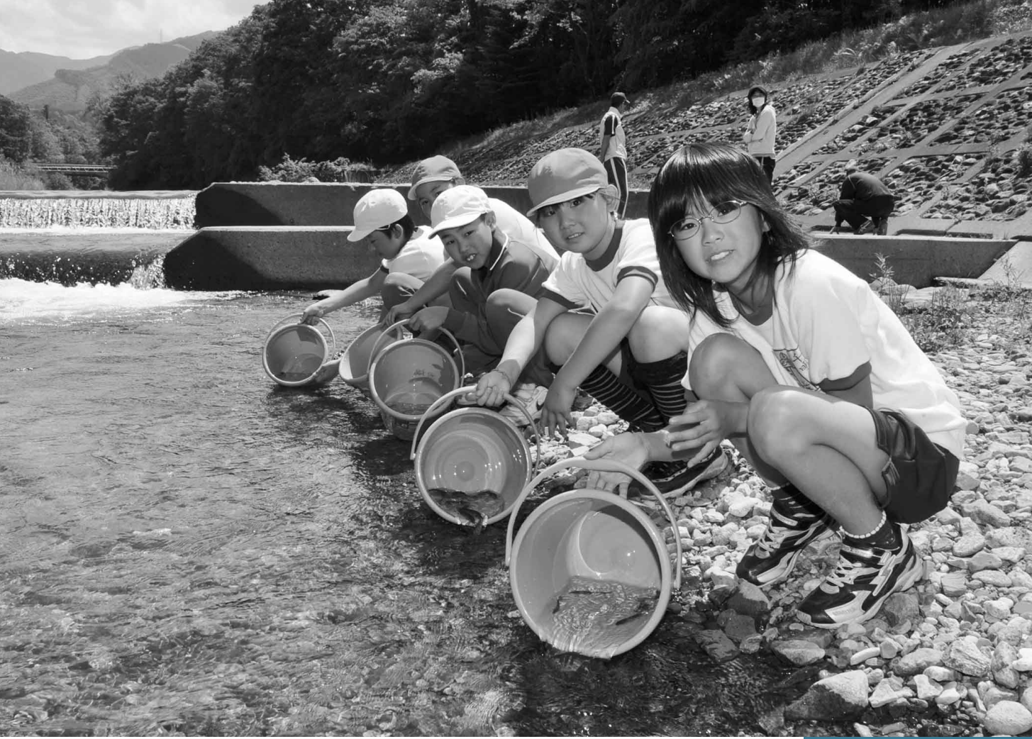
6月3日 「ふるさとの魚」放流促進事業（利根町・坪川）