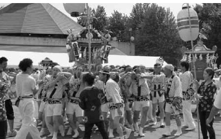
白沢町総務課総務振興係 ☎内線13

とき 7月25日(日)午後2時～4時 ところ 道の駅「白沢」内おまつり広場 内容 町内各地区みこしの共演、地域 特産物や飲食物の提供など、楽しい イベントが盛りだくさんです