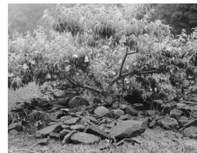
果樹園や田んぼも流れ込んだ土砂により大きな被害を受けた

大雨警報の発表中に、土砂災害が発生する恐れが高まったとき、県と前橋地方気象台が共同で発表する防災情報です。傾斜地に住んでいる人は、土砂災害の発生に一層の警戒をし、避難準備情報や避難勧告を受けたときは、適切な防災対応をお願いします。