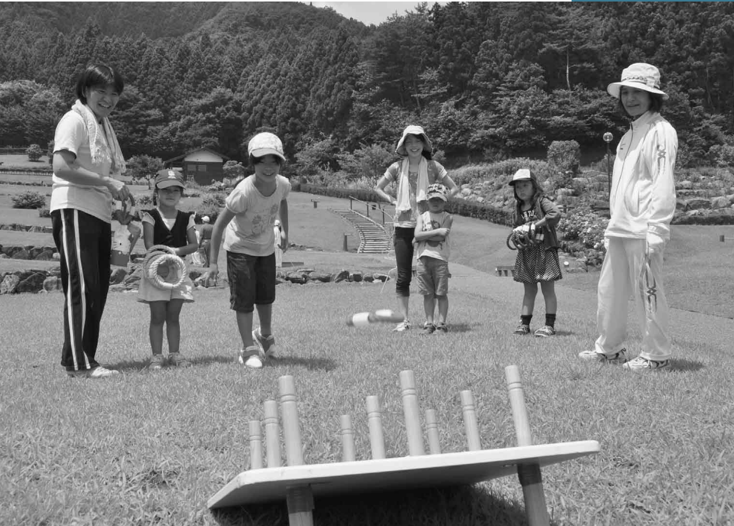
7月17日 およこニューススポーツ講習会（ニューススポーツ広場）