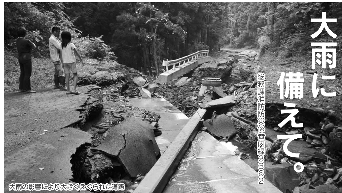
大雨の影響により大きくえぐられた道路

近年、大雨による被害が増加しています。7月には、市内でも集中豪雨による住宅や道路の浸水、農作物への被害などが発生しました。いざというときに備え、日ごろから災害に対する準備と具体的な安全対策を取るよう心掛けておきましょう。