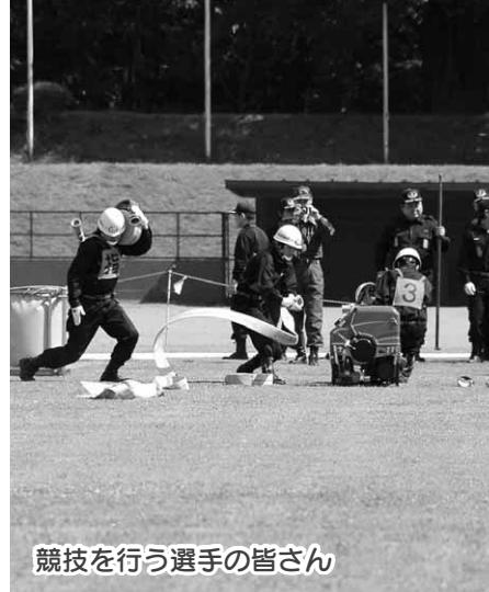
競技を行う選手の皆さん