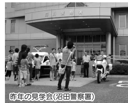
昨年を見学会(沼田警察署)

市では、子どもたちの夏休みを利用して、市内の主な公有施設を巡る「親子施設見学会」を開催します。親子の触れ合いを深めながら、楽しい一日にしてください。