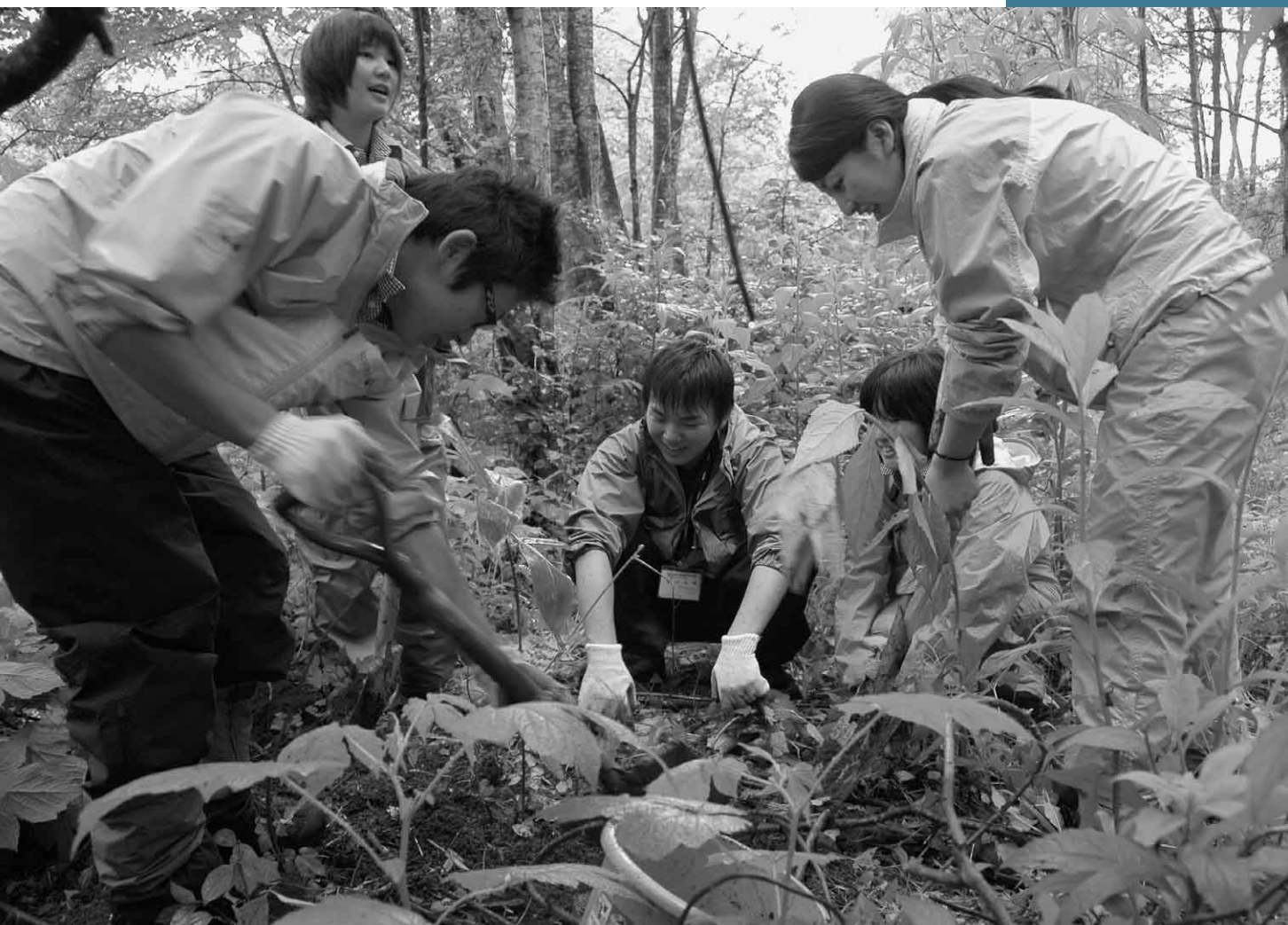
6月21日 プナ幼木移植・自然観察会(玉原高原)

昔より3万5千石が沼田城主の格式といわれる中、実相院は10万石の格式を誇った名刹である。日光を開いた勝道上人が、平安時代の延暦年間(794-804)に子持山を背にする景勝の地に一庵を開創した実相坊がその前身という。従って、住職の乗った御駕籠など珍しい寺宝が多い。鎌倉時代初頭に中国から入った唐破風と呼ばれる屋根を前後に付けた唐門(写真①)、円柱の四脚門で主要部はケヤキの白木造り、随所に唐草絵様の彫刻、江戸中後期の建造と推定される。古刹の玄関に似つかわしい。本堂の内陣と外陣境の欄間に天上界で音楽を奏でるといわれる飛天が、中央の龍を挟み極彩色の美しい姿を見せる。雅楽でも使われる「笙」と呼ばれる管楽器を吹く飛天(写真②)は、大きな翼を持つ姿で舍利の上を舞う。花の香をにおわせ、天より舞い降りたかの飛天(写真③)は、シンバル状の2枚1組の「鉞」という打ちものの仏具を鳴らす姿である。彫刻の裏面に宝暦9(1759)年などの年号と施主名があり、これらの彫刻が先人の供養のために造られたことが分かる。(沼田市文化財調査委員：金井竹徳)