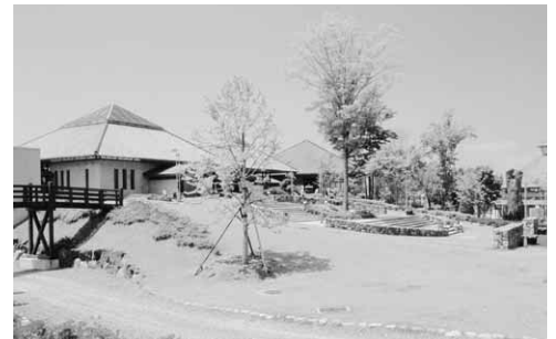
白沢高原温泉望郷の湯