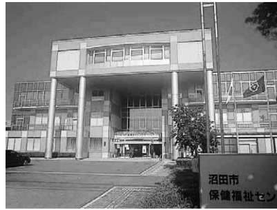
沼田市保健福祉センター