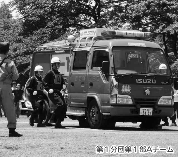
第1分団第1部Aチーム

利根沼田消防ポンプ操法競技会ポンプ車の部で優勝した第一分団第一部Aチームが、八月二十日(水)に前橋市の県消防学校で行われる県消防ポンプ操法競技大会に出場します。温かいご声援をよろしくお願います。