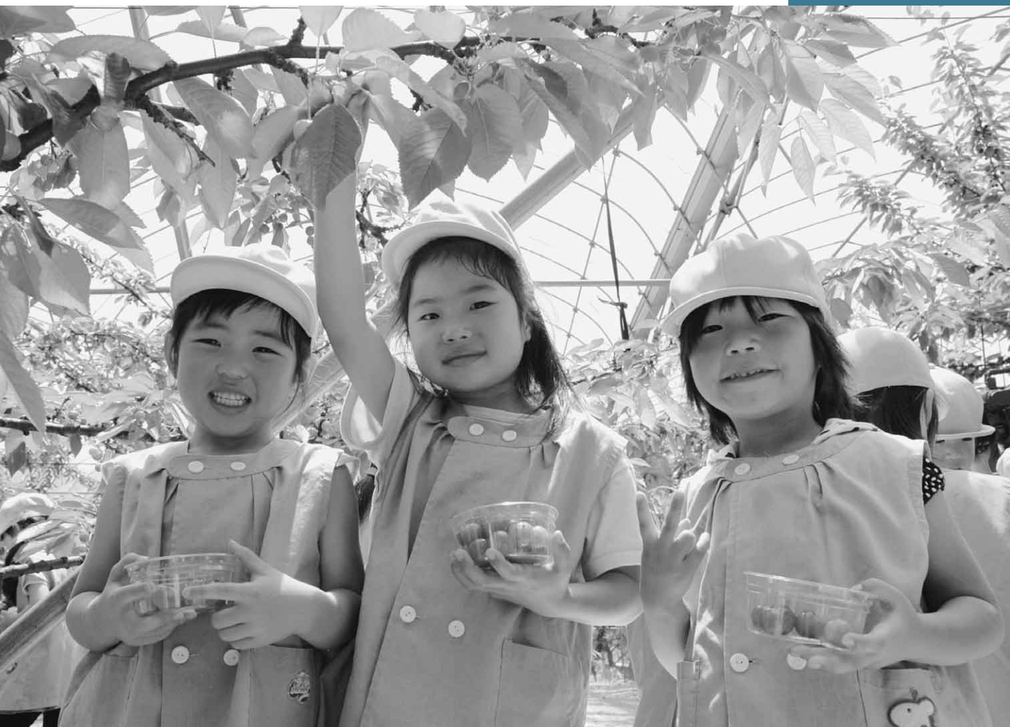
6月13日 第7回沼田さくらんぼ組合開園式（沼須町・あざみ園）