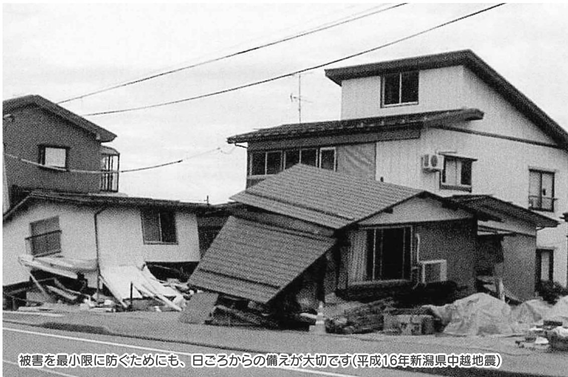
被害を最小限に防ぐためにも、日ごろからの備えが大切です(平成16年新潟県中越地震)

市では、「安心安全で機能的なまちづくり」を推進するため木造住宅を対象として、無料で耐震診断者を派遣し耐震診断を行い、結果をお知らせします。