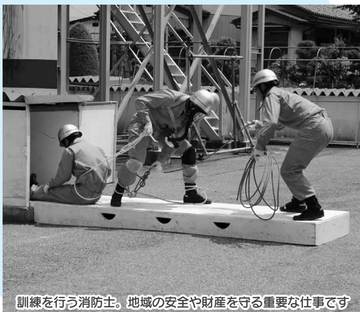
訓練を行う消防士。地域の安全や財産を守る重要な仕事です