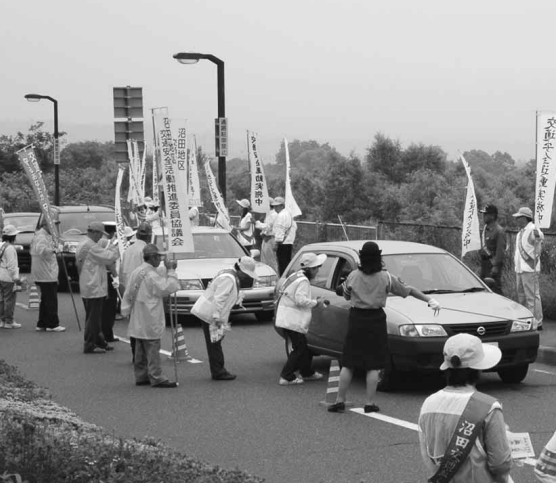
7月に月夜野道路情報ターミナルで行われた夏の県民交通安全運動街頭キャンペーン

正しく着用して、同乗者(助手席・後部座席)にも必ず着用させましょう。 夕暮れ時と夜間の歩行中・自転車乗用中の交通事故防止 自転車は道路交通法上の車両です。車道を通行する場合は左側を通行し、信号を守って交差点では必ず一時停止をするなど安全確認を徹底しましょう。また、夕暮れ時や夜間には、ライトの点灯や反射材の活用によりほかの通行車両や歩行者に自分の存在を早めに知らせましょう。 歩行者は目立つ服装や反射材を付けるなど、運転者などから見やすくなる工夫をしましょう。 飲酒運転の根絶 飲酒運転の危険性や違法性を認識して飲酒運転は絶対に行ない、させないという強い決意を持ちましょう。 これらの項目を守って、交通事故のない明るい社会づくりに努めましょう。