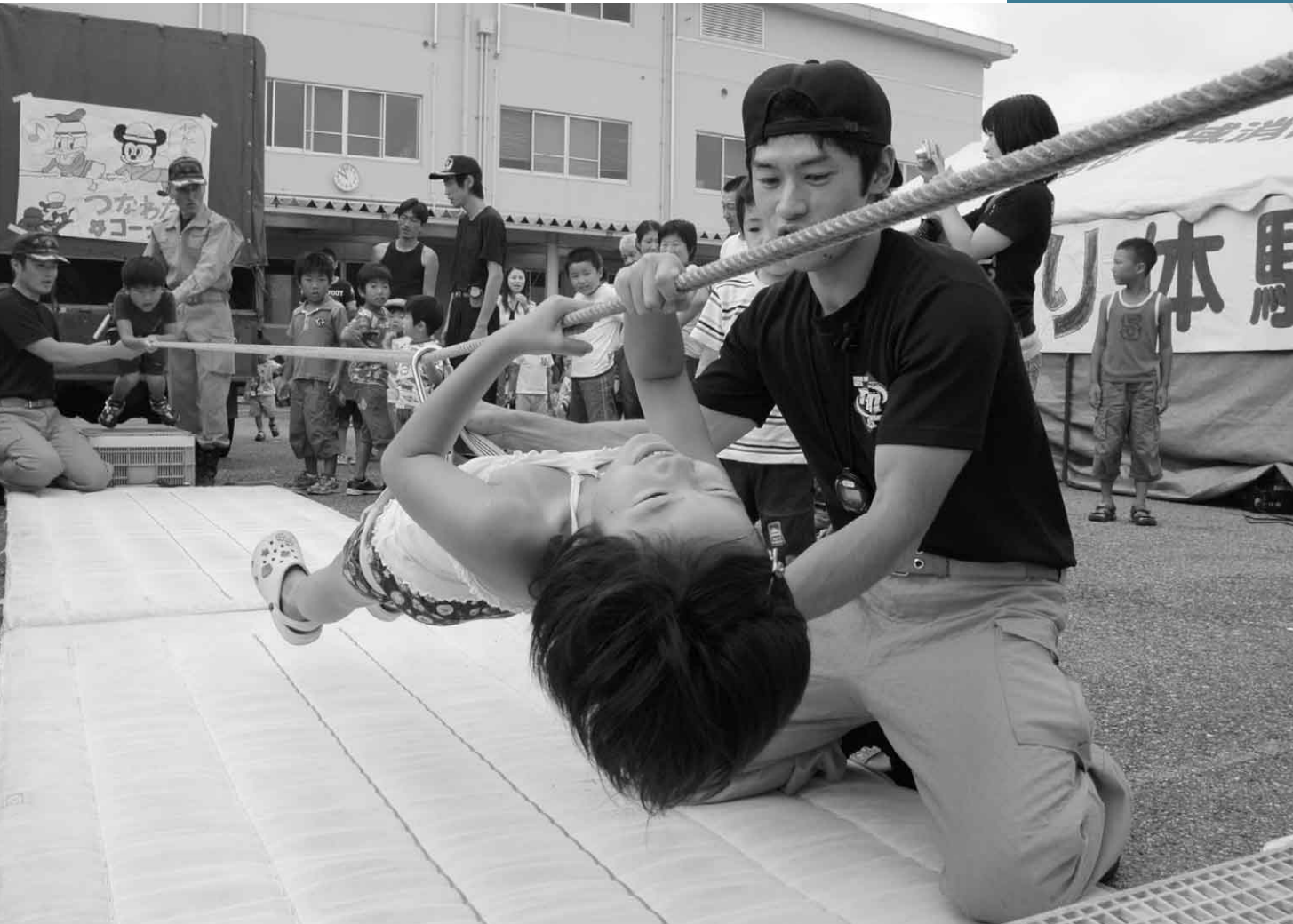
8月10日 レスキュー隊員体験会(会場：利根沼田広域中央消防署)

徳川幕府の宗門奉行井上筑後守政重は、明暦4(1658)年「真田伊賀守領分、沼田ヨリ宗門多申候、東庵ト申イルマン同前ノ宗門御座候…」とキリシタンを摘発した「吉利支丹出申所之覚」で、真田領沼田に多くのキリシタン信者がいたことを記している。足尾より川場へ家族で移り住んだ「東庵」、真田藩士で三百七石取の「高野甚五左衛門」の二系統。元和6(1620)年、来沼した宣教師ベント・フェルナンデス、日本人神父式見マルチノの伝道の記録など、沼田には驚くべきキリシタン史が瞭然とあり、その証としてマリア観音像や神父像、踏み絵、十字架が残されている。割田家のマリア観音は、時に城の役人が来て家人の目で像をいたぶったといわれる。生方記念文庫の神父像は東庵の通った白沢町尾合より見付かった木像で手など傷んでいるが、今もパードレの姿を残している貴重な遺物である。 (沼田市文化財調査委員：金井竹徳)