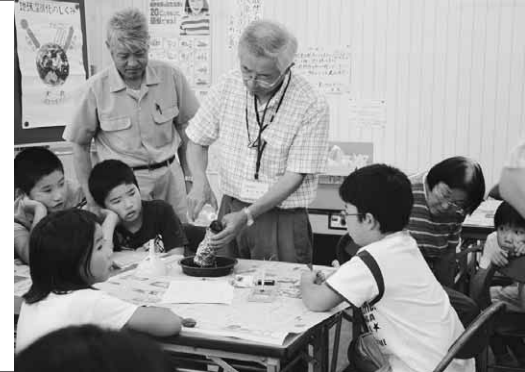
市内の小学生27人とその保護者が参加して行われました

フジエッセ 夏休み環境教室 八月二十一日(木)、上原町区民館で夏休み環境教室が行われました。子どもたちは、県環境アドバイザーからの指導を受けて、悪戦苦闘しながらも、初めての日時計作りなどを楽しみました。木炭で電池を作る実験では、電球の点灯と同時に大歓声。最後は、分りやすい地球温暖化の話があり、参加者みんなで真剣に温暖化を勉強しました。