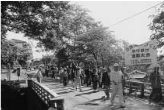
昨年は川田地区で行われました