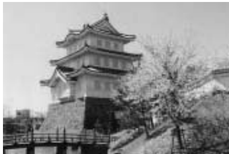
忍藩十万石の要「忍城(おしじょう)」

とき 10月1日(日)午前7時30分 分市役所前出発、午後5時帰着予定(交通事情などにより時間の変更もあります)