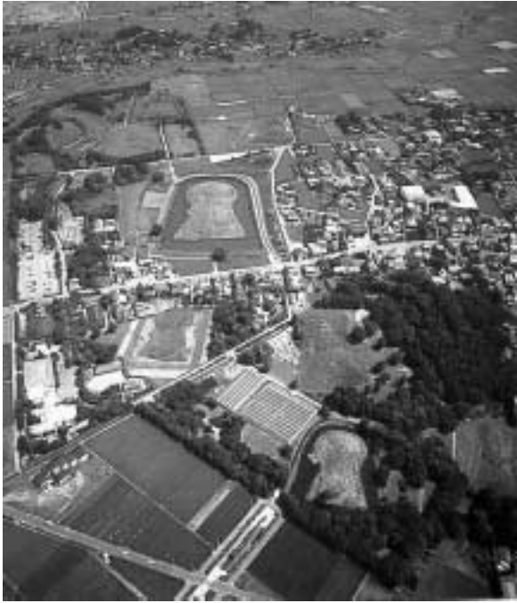
—さきたま古墳公園全景—

5世紀末から7世紀始めにかけて築造された9基の大型古墳群で、国指定史跡となっています