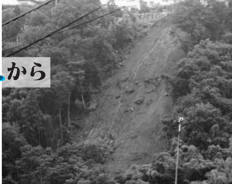
7月19日下久屋町で発生した土砂崩れ災害

今年の梅雨は梅雨前線が日本列島に停滞し全国各地で記録的な大雨が降りました。7月15日以降、九州から東日本にのびた梅雨前線により、九州地方から関東地方までの広い範囲で大雨となり、特に九州南部や長野県などでは7月15日から7月20日午後3時までの総雨量が、多いところで平年7月の月間雨量の2倍を超えるなど記録的な大雨になり大きな災害が発生しました。本市においても、7月17日から19日の3日間で平年7月の降雨量152.8mmを超える165.5mmの雨量を観測し、土砂崩れや法面崩壊などの災害が発生しました。台風や集中豪雨そして地震などの自然現象そのものをくい止めることはできませんが、被害がでないようにしたり、被害を最小限にとどめることはできます。「いざ」というときに備え、日ごろからしっかりした心構えと具体的な安全対策を講じておくことが大切です。