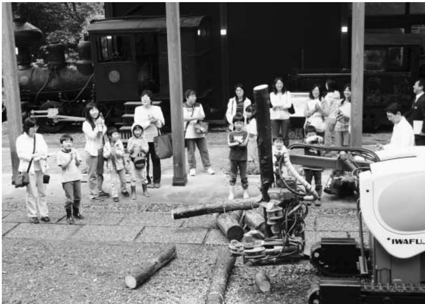
7月21日 親子施設見学会(林野庁森林技術総合研修所 林業機械化センター：利根町根利)