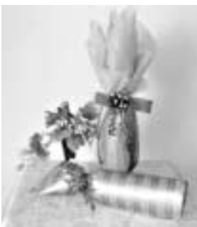
▲ラッピング作品の一例

■初心者コース とき 9月5日(火)から8日(金)午後2時から4時30分まで ■ワード・エクセルコース とき 第一回目は、9月9日(土)と10日(日)午前10時から午後