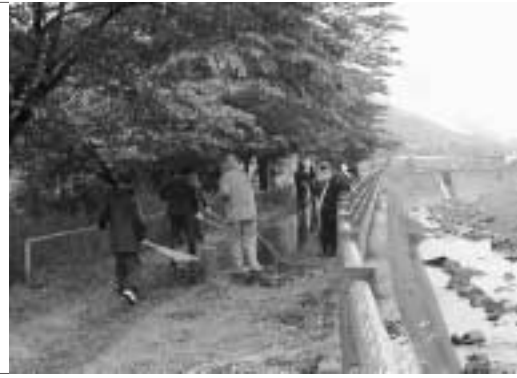
7月5日(水) -清掃活動のひとこま-