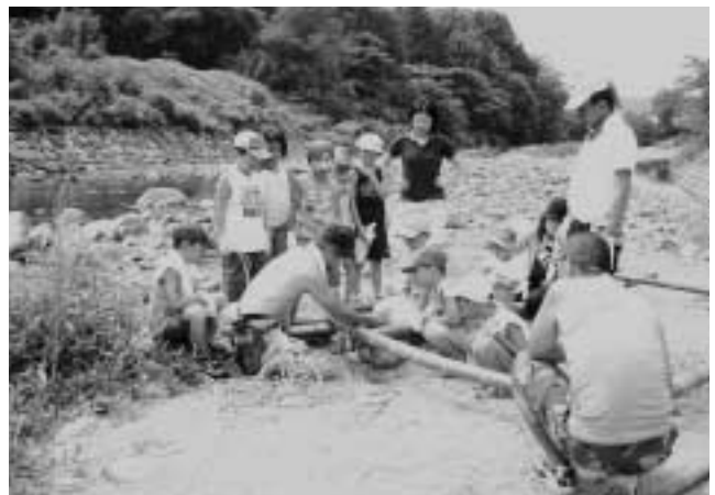
子ども支援センター『結いんぐ』のいかだ作り

市では、市民協働によるまちづくりを進めるうえでの考え方・ルール・体制などの『基本方針』を策定します。市民が主体的に研究する組織を設置するため、公益団体代表委員のほか公募によるメンバーを募集します。 応募資格 18歳以上の市内に在住している人で、ボランティア（無報酬）で参加できる人 任期 10月から基本方針が定まるまで 募集人数 5人程度 応募期間 9月1日（金）から15日（金）まで（郵送の場合15日