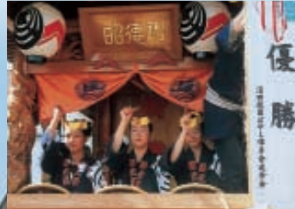
▲祇園囃子競演会優勝 西原新町