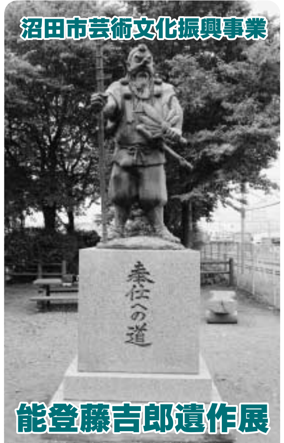
◀沼田駅西公園の「天狗像」