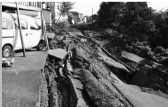
地震により滑落した道路 (新潟県中越地震:長岡市提供)

災害時の屋外では、ブロック塀が倒れたり窓ガラスや看板などの落下やがけ崩れなども考えられます。頭を保護し、安全な建物か広場に避難しましょう。