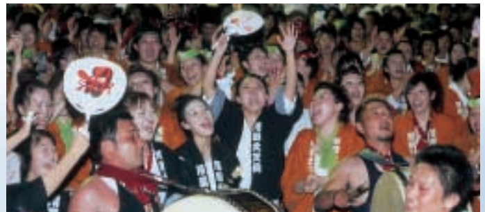
▲天狗みこしのフィナーレ「ラッセラ」