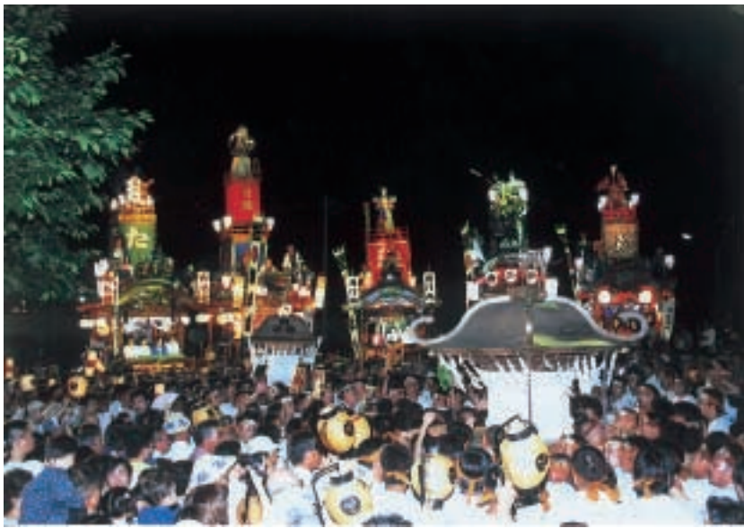
▲神社みこしの共演