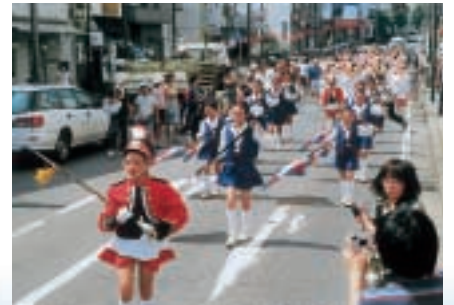
▲沼小マーチング隊フレッシュ・ウインズ