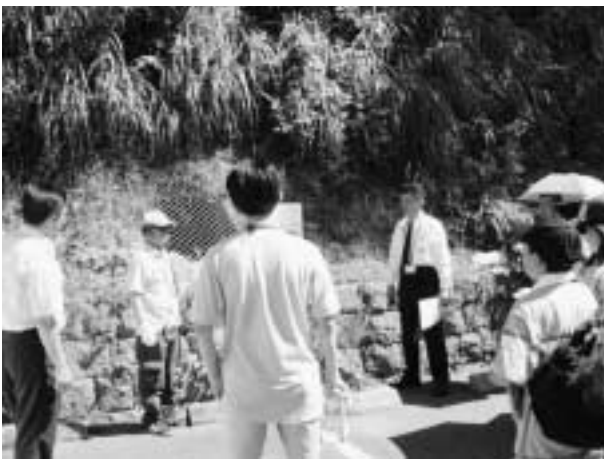
旧松山町防空壕跡を視察（長崎県長崎市）