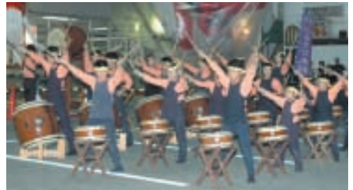
▲薄根ふるさと太鼓も熱演