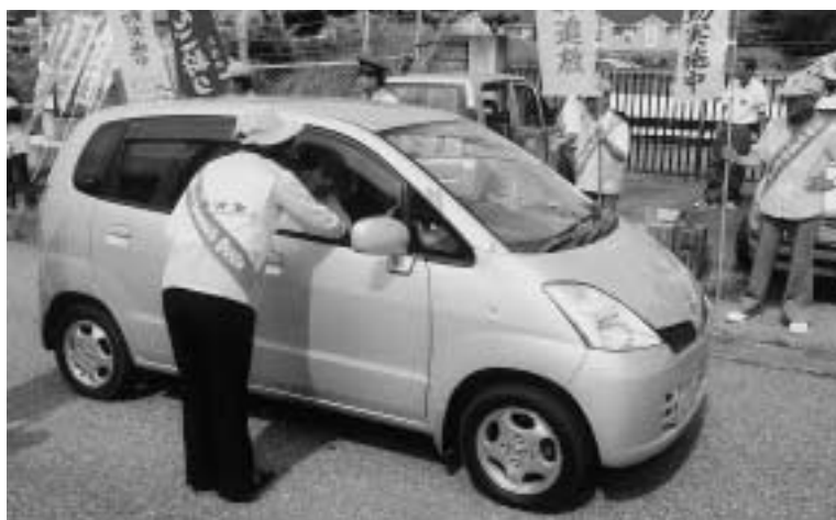
水道会館前で街頭キャンペーン