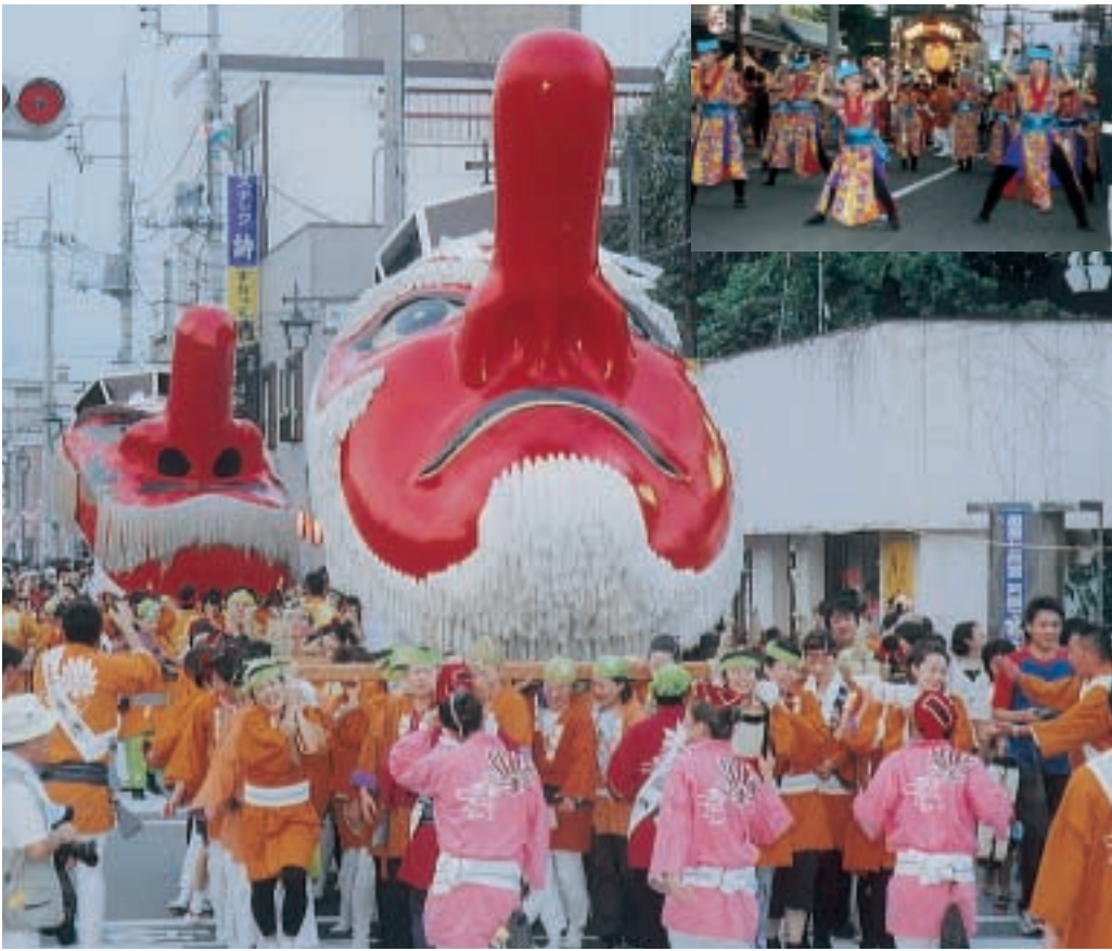
▲3日と5日の2日間、大勢の女性により担がれた天狗みこし

八月三日、四日、五日。照りつける夏の日差しの中、沼田の街が人々の熱気により熱く燃えた三日間。語り尽くせない思い出を残してくれた沼田まつりを振り返ります。