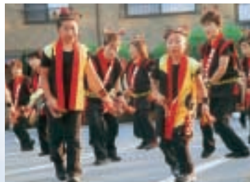
▲鳴子を手に「だんべえ踊り」