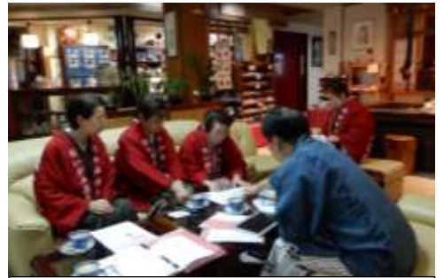
J.POSH事務局から説明を受ける女将の会の皆さん

市内で活動する、女性の元気応援団「もものわ」が、認定NPO法人J. POSH（日本乳がんピンクリボン運動）の取組を老神温泉旅館組合女将の会に紹介、賛同していただき、取組がスタートすることになりました。