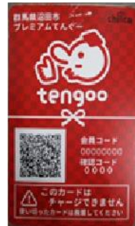
健康てんぐーカード