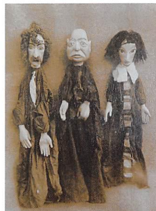
<<ギニョールマリオンネット>>