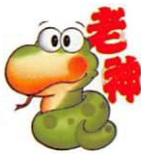
老神温泉キャラクター じゃおうくん

※天候その他の事情により、イベントプラン並びにウォーキングコースを変更させていただく場合があります。