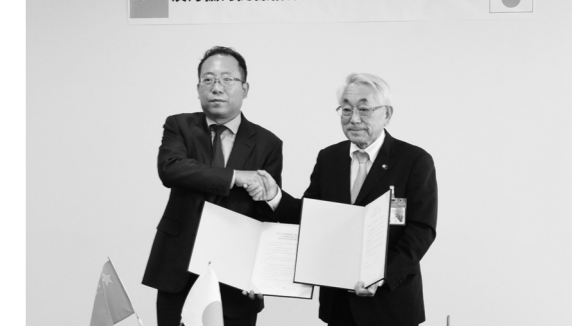
日本国群馬県沼田市と中華人民共和国四川省江油市の友好協力関係構築に関する覚書締結調印式

中華人民共和国四川省江油市の関係者が来沼し、両市の経済・観光・農業などの分野で協力を深める覚書を締結しました。江油市は四川省の省都である成都市から北に約160kmの距離にある、人口約90万人の都市で、詩人・李白の故郷としても有名です。昨年11月には、江油市で国際的な観光イベントが開催され、本市から市長が参加し観光などをPRしています。