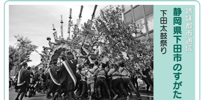
姉妹都市通信 静岡県下田市のすがた 下田太鼓祭り

いやりのある運転を心掛けましょう。 自転車は「車両」です。信号や一時停止を厳守し、車道を通行するときは左側を通行しましょう。 飲酒運転の危険性や違法性を認識し「飲酒運転を絶対にしない・させない」ことを徹底しましょう。 一人一人が交通安全を自分のことと考え、交通ルールとマナーを守り、交通事故のない明るい社会づくりに努めましょう。 問い合わせ 生活課生活係 ☎内線3051へ