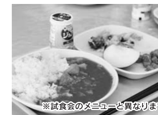
※試食会のメニューと異なります