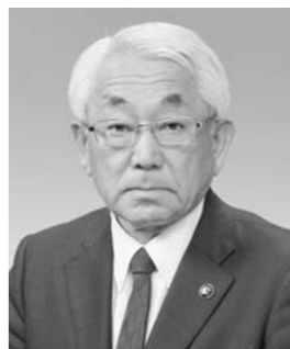
沼田市長 横山 公一

襲など、自然災害に見舞われ、群馬県内でも多くの人が被災されました。心よりお見舞いを申し上げますとともに、一日も早い復興をお祈り申し上げます。本市におきましても、テラス沼田の防災機能を十分に活用しながら、危機管理の徹底に努めていく所存です。