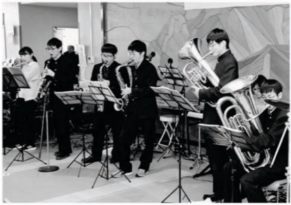
楽しい企画が盛りだくさん！ 第24回ごったくまつり・ボランティアフェスタぬまた 12月1日(日)

古本市を開催します 市民の皆さんからいただいた本と、図書館で廃棄する雑誌のバックナンバーを無料配布します。