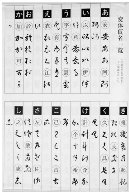
『ぐんまの古文書』(群馬県立文書館編)より