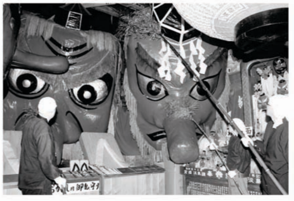
新しい年を迎えるために 迦葉山弥勒寺掃煤会 12月13日(金)

「利根沼田、いろんな人が暮らしてる～みんなちがって、みんな○○」をテーマに、保健福祉センターで開催されました。当日はワークショップや手作り品販売、子どもフリマ、活動展示などさまざまなブースが多くの来場者でにぎわい、また尾瀬高校吹奏楽部をはじめ各種団体のステージパフォーマンスが、会場内をさらに盛り上げました。