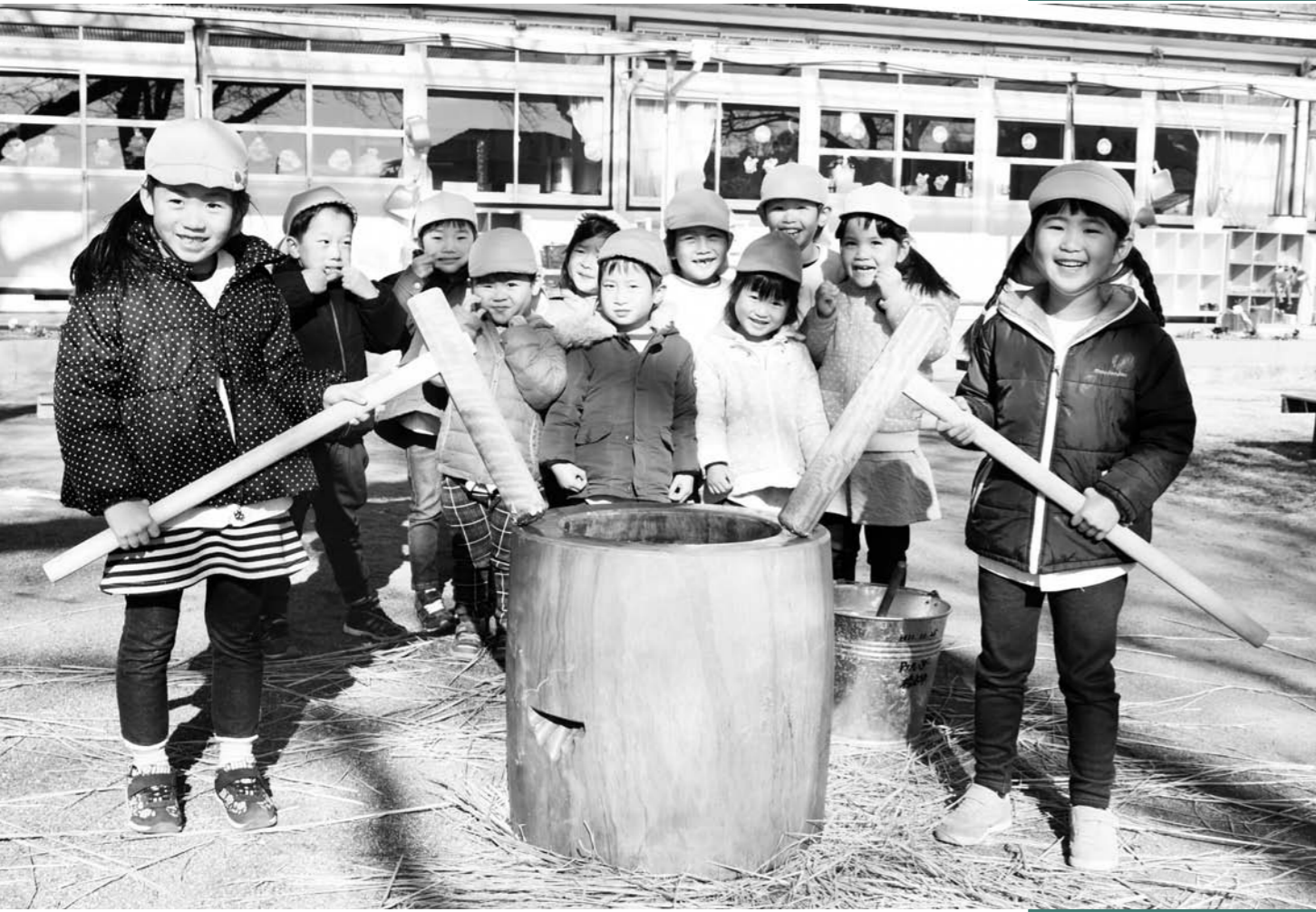
12月13日(金) 餅つき大会 (榛名幼稚園)