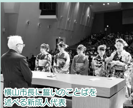
横山市長に誓いのことばを述べる新成人代表

新成人の新たな門出を祝う「令和2年成人式」が1月12日(日)、利根沼田文化会館で開かれました。平成11年度生まれの新成人515人(男266人、女249人)のうち409人が出席し、人生の節目を喜び合いました。 横山市長は「人生の先輩の長年の経験による助言を学び生かしながら、新しい時代を歩んでほしい」と激励。新成人代表の5人は登壇し「一つ一つの困難を乗り越える力を養うため、努力していきたい」と誓いました。 アトラクションでは、実行委員が制作した中学校別の映像が上映されました。地域の子どもに絵本を購入する資金となる「児童図書募金」も行われ、実行委員は募金箱を持って会場へ協力を呼び掛けました。