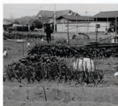
市民ふれあい農園