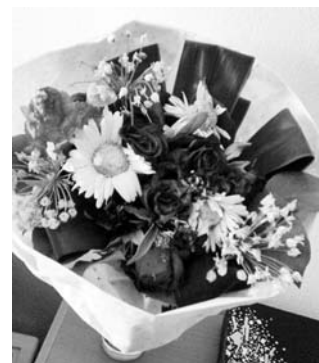
ティーネがバレンタインデーにもらった花束

て、この日は不要と思っている人もいます。パートナーを喜ばせるのはバレンタインデーに限らず、1年に365日もあるからです。商売主義と思って乗らない人もいます。