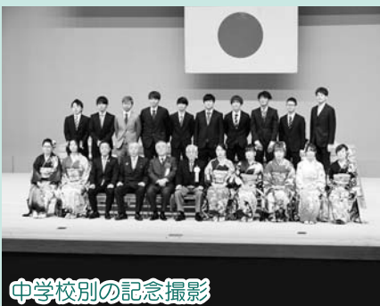
中学校別の記念撮影