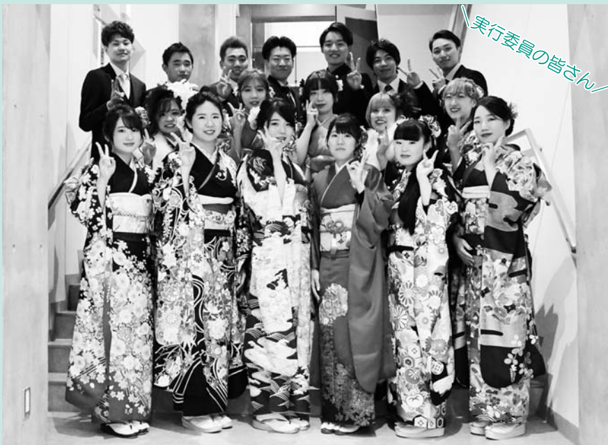
実行委員の皆さん