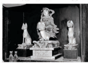
厨子の中の茶枳尼天像

本年も、2月11日(火)の初午祭には、主神の「茶枳尼天」のお姿もご開帳されるとのこと、万能の効験にあやかりたい。