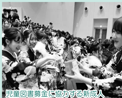
児童図書募金に協力する新成人