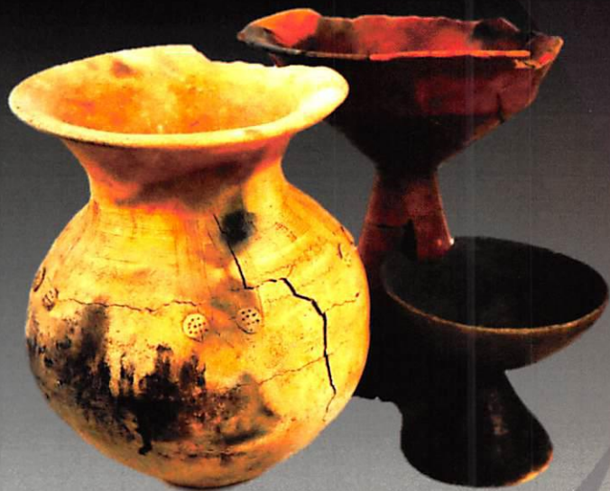
「出土した弥生土器」