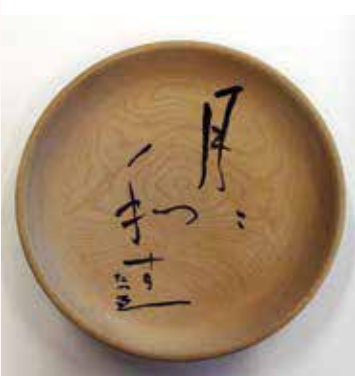
木皿「月に和す たつゑ」