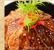
写真はイメージです やまと豚のカルビ丼セット (サラダ付) ¥1,500 (税込)