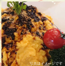
写真はイメージです ブラとろオムライス トリュフソース (サラダ付) ¥1,700 (税込)