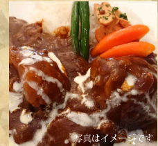
写真はイメージです 上州牛のビーフカレー (サラダ付) ¥1,500 (税込)