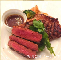
写真はイメージです アングス牛のステーキセット (サラダ・ライス付) ¥2,000 (税込)