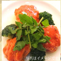
写真はイメージです 赤城地産のトマト煮 (サラダ・ライス付) ¥1,500 (税込)