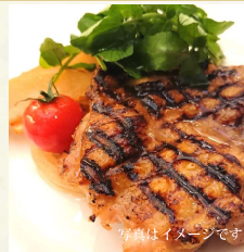
写真はイメージです 赤城地産のグリル (サラダ・ライス付) ¥1,500 (税込)