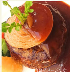
写真はイメージです 上州牛ハンバーグセット (サラダ・ライス付) ¥1,800 (税込)

※ご注文は当日10時までにお願い致します (お持ち帰り容器でのお渡しとなります)