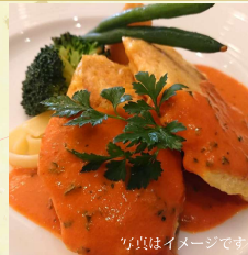
写真はイメージです ノルウェーサーモンのヒカタ (サラダ・ライス付) ¥1,600 (税込)