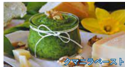
クマニラペースト

血圧や動脈硬化の予防、代謝や消化吸収のアップに効果があります。ドイツの冬は寒くて暗く、心身が疲れやすくなるので、元気を付けるためにクマニラを食べます。5月はレストランでもクマニラ料理が増えるので、機会があればお試しください。