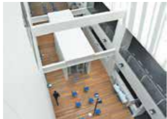
【写真左から】 谷川岳を一望(7階 ルーフガーデン)、テ ラスでゆったりお茶で も(3階市民課前)、 吹き抜けを上から見下 ろす(6階南エリア)