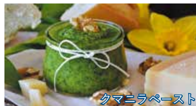
クマニラペースト

血圧や動脈硬化の予防、代謝や消化吸収のアップに効果があります。ドイツの冬は寒くて暗く、心身が疲れやすくなるので、元気を付けるためにクマニラを食べます。5月はレストランでもクマニラ料理が増えるので、機会があればお試しください。