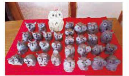
8月8日(土)～10月4日(日) 気仙沼教室作品 旭が丘学園フクロウ陶芸教室 (令和元年12月21日開催)