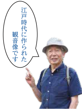
江戸時代に作られた 観音像です

厨子の内、像高40センチの慈母観音の懷に、5センチほどの幼児が母に甘えるよう右手を広げ、左手は握る姿が実にほほ笑ましい。そして、観音は母性が漂い、優しきや温かみが感じられる。高平は沼田城下の宿跡で、歴史の名残も見られる場所。観音堂は今はないが、慈母像は実相院(住職大岡玄尚尾合禪定院副住職)に今もなお大切に安置される。