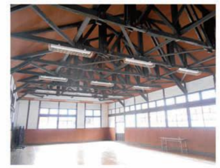
問合せ 市民協働課協働推進係 ☎内線3051

9月1日から9月10日まで国土交通省が定める「屋外広告物適正化旬間」です。 県では、この期間に併せて9月1日から30日までに屋外広告物美化キャンペーン期間として、違反簡易広告物の除却作業や違反広告物の是正指導など、屋外広告物の適正表示に向けた取り組みを重点的に実施します。 また、群馬県屋外広告物条例を制定して屋外広告物に関するルールを定めています。屋外広告物を設置するために、この条例に従い、小規模