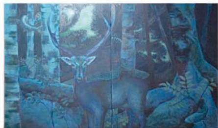
9月25日(金)~9月27日(日) 南雲麻衣作品展 南雲麻衣教室