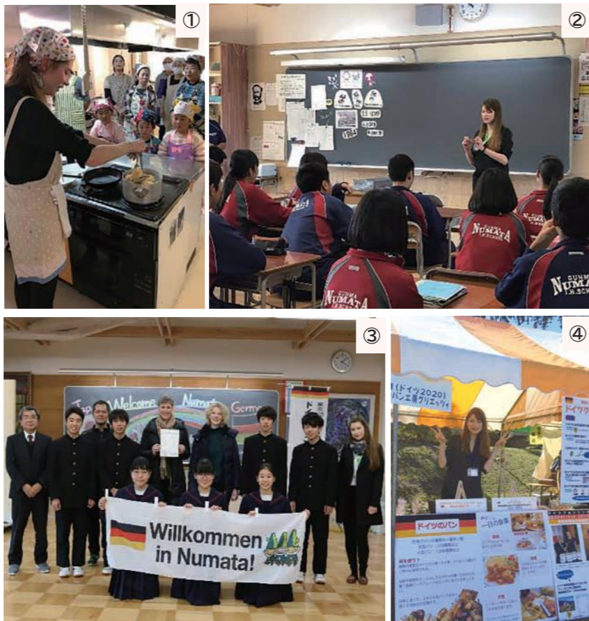
①市民向けの料理教室を毎月開催②学校を訪問してドイツ文化を紹介③ドイツフェンシング協会会長を迎え中学生と交流④イベントではクイズも出題

お弁当を持参するので、カボチャやひじきの煮物などを作り置きします。ドイツに帰ったら日本食が恋しくなりそうです