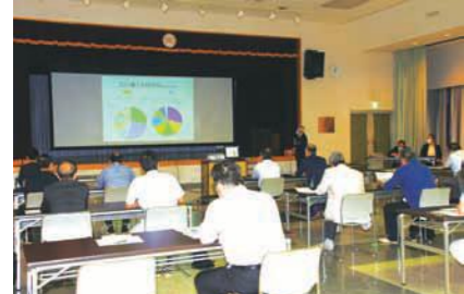
白沢支所で開催の様子

9月の健康テレホンサービス ☎027-234-4970をダイヤルすると、3分間の健康講話が聞けます。 月曜日 骨粗鬆症の予防 火曜日 歯の生え変わり時期 水曜日 排卵と月経のしくみ 木曜日 歯の被せ物が外れたら 金曜日 乳児の消化不良 土・日曜日 中高年の歯みがき 【直接相談タイム(歯科)】 新型コロナウイルス感染症による影響で当面の間休止とさせていただきます。