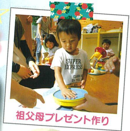
祖父母プレゼント作り