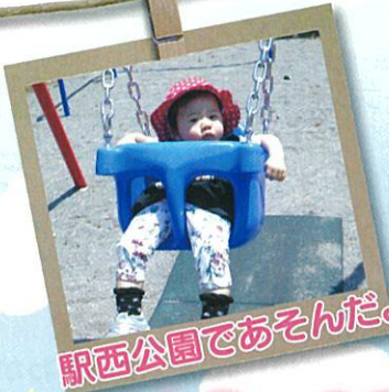
駅西公園であそんだよ