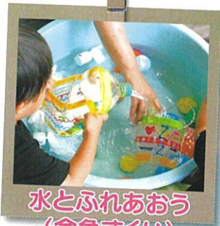
水とふれあおう (金魚すくい)