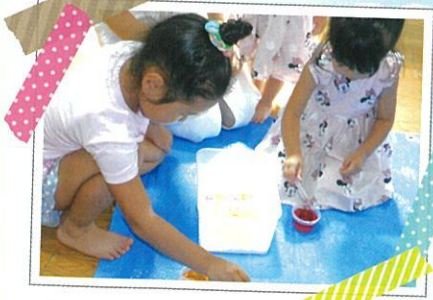
不思議な感触あそび