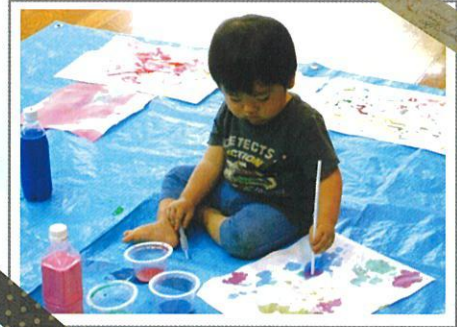
色水遊びと氷でお絵かき