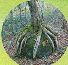
岩を抱くアオダモ

玉原高原は、標高1,200~1,600mの 国有林に開かれた緑豊かな 森林リゾートです。 遊歩道では数多くの植物や 鳥・小動物にも出会えるでしょう。