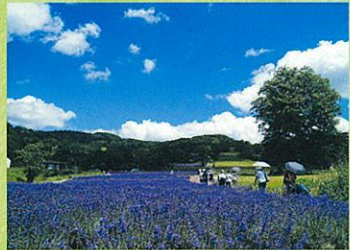
ラベンダーは7月中旬から8月中旬まで が見頃です。

ラベンダーパーク 営業期間中(6月下旬 ~8月下旬)は、 入園料が必要とな りますので、ご注意 下さい。