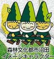
森林文化都市沼田 イメージキャラクター