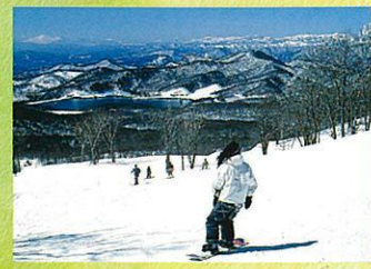
ゴールデンウィークまでスキー・ スノーボードが楽しめます。

ラベンダーパーク 営業期間中(6月下旬 ~8月下旬)は、 入園料が必要とな りますので、ご注意 下さい。