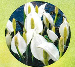
湿原では4月下旬から5月中旬 まで「ミスバショウ」が見頃です。