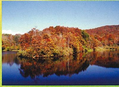
四季折々の表情を映したす「玉原湖」 紅葉は10月上旬から下旬までが見頃です。