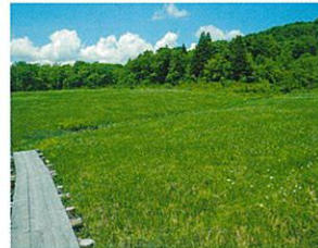
「小尾瀬(こおぜ)」 とも言われる玉原湿原