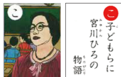
「改訂きりえ沼田かるた」の札として親しまれている